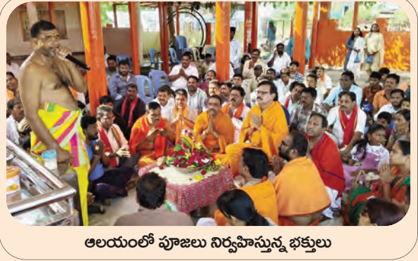
ఆలయంలో పూజలు నిర్వహిస్తున్న భక్తులు