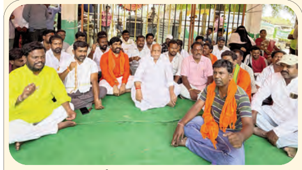
దీక్ష చేస్తున్న కౌన్సిలర్లకు సంఘీభావం తెలుపుతున్న ఎమ్మెల్యే పవార్ రామారావు పటేల్

మద్యం తాగి వాహనాలు నడిపే వారిపై కఠిన చర్యలు తప్పవని ఎస్పి రమేష్ హెచ్చరించారు. మద్యం మత్తులో వాహనాలు నడిపి ప్రమాదాలకు గురికావడని, దీనివల్ల కుటుంబాలు రోడ్డున పడతాయని నూచించారు. మండల పోలీస్ స్టేషన్ పరిధిలో గత వారం రోజులుగా నిర్వహించిన వాహన తనిఖీల్లో మద్యం సేవించి పట్టుబడిన 20 మందిని బోర్డ్ కోర్టులో హాజరుపరిచినట్లు తెలిపారు. కేసును విచారించిన ఫస్ట్ క్లాస్ మెజిస్ట్రేట్ సందీప్ కుమార్ నిందితులకు ఒక్కొక్కరికి వెయ్యి రూపాయల చొప్పున మొత్తం 20,000 రూపాయల జరిమానా విధించారని పేర్కొన్నారు. నిబంధనలు ఉల్లంఘించిన మరో ముగ్గురికి జైలు శిక్ష విధించినట్లు వెల్లడించారు. రోడ్డు భద్రత నియమాలను ప్రతి ఒక్కరూ పాటించాలని ఈ సందర్భంగా ఆయన కోరారు.