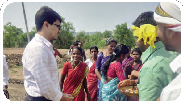
గ్రామస్తులతో మాట్లాడుతున్న ఐటిడిపి పిఠి అధికారి మంద మకరండు