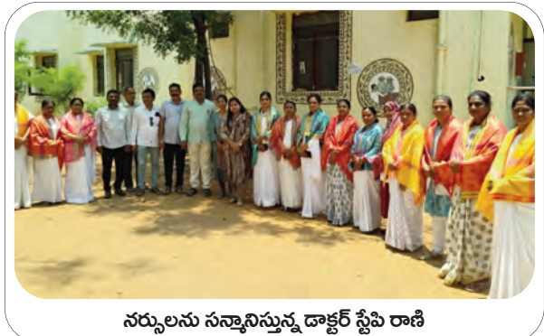
నర్సులను సన్మానిస్తున్న డాక్టర్ స్టేపి రాణి