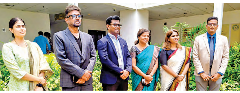
సచివాలయంలో విలేజ్ కల సమావేశంలో పాల్గొన్న గ్లోబల్ క్యాంబం ఏవ సాఫ్ట్వేర్ బృందం