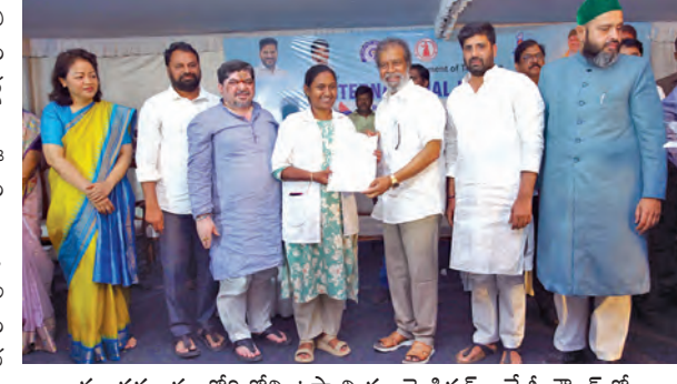
మంగళవారం కోల్పోని ఉన్నానియా మెడికల్ కాలేజీ గ్రాండ్లో నియామక పత్రాలను అందజేస్తున్న వైద్య మంత్రి దామోదర రాజనర్సింహ, చిత్రంలో మంత్రి పోస్టు తదితరులు

ప్రభుత్వ నర్సుల కళాశాలలను ఏర్పాటు చేశామని, అందులో 960 టీఎస్సీ నర్సుల స్థానం అందుబాటులోకి తీసుకొచ్చామన్నారు. ప్రస్తుతం రాష్ట్రంలో 3 మిలియన్ల ట్రైనింగ్