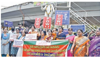
హైదరాబాద్ లో ఆందోళన చేస్తున్న మహిళా సంఘాల నేతలు

లీకేజీపై సిబిఐ దర్యాప్తు వేగవంతం ప్రధాన నిందితుడు కైరార్, 15మంది అరెస్టు నీట్ను పూర్తిగా రద్దు చేయాలి: తమిళ సీఎం విజయ్