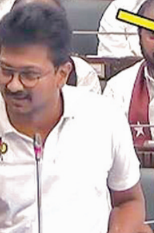
రాధన్ గుర్తుచేశారు. తప్పుడు హామీలతో విజయ్ ఎన్నికల్లో గెలిచారని, ఆయన ఇచ్చిన ఎన్నికల హామీలపై ఆయననే స్పష్టత లేదని ఎద్దేవా చేశారు.

చెన్నై, మే 13: తమిళనాడు అసెంబ్లీలో బలపరచడం సందర్భంగా అధికార డిఎంకె, ప్రతిపక్ష డిఎంకె మధ్య మాటల యుద్ధం తారస్థాయికి చేరింది. ఉదయనిధి స్టాలిన్ చేసిన రీల్ వర్షాన్ని రెబల్ వ్యాఖ్యలు ఇప్పుడు రాజకీయపర్జల్లో హాట్ టాపిక్ గా మారాయి. ముఖ్యమంత్రి విజయ్ ప్రభుత్వాన్ని లక్ష్యంగా చేసుకుని డిఎంకె శాసన సభాపక్ష నేత ఉదయనిధి స్టాలిన్ విమర్శనాల్పన సందించారు. తమిళనాడుకు కావాలింది రియల్ ప్రభుత్వమే కాని, సినిమాల్లో కనిపించే రీల్ ప్రభుత్వం కాదని, విజయ్ పార్టీని రాష్ట్రంలోని 65 శాతం మంది ఓటర్లు తిరస్కరించారని, డిఎంకె ప్రజలకు ఎన్నికల్లో గెలిచారని, ఆయన ఇచ్చిన ఎన్నికల హామీలపై ఆయననే స్పష్టత లేదని ఎద్దేవా చేశారు.