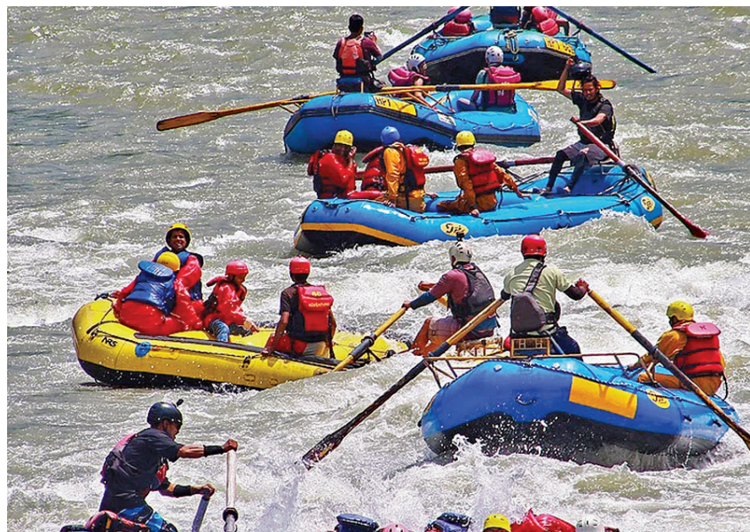
హిమాచల్ ప్రదేశ్ లోని కులు జిల్లా మనాలిలో బుద్ధవారం బియాస్ నదిలో రివర్ రాఫ్టింగ్ చేస్తున్న వర్షాటకులు

రోజుల క్రితం ఏజెంట్ ద్వారా నేపాలీ మహిళను పనిలో పెట్టుకున్నారు. ఈ సెల 11వ తేదీన మహిళ పుట్టిన రోజు పేరుతో దంపతులను నమ్మించింది. రాత్రి 10 గంటలకు గట్టి ఎంక్వేట్ గేట్ దగ్గర ఉన్న సెక్యూరిటీతో నేపాలీ ముఠా చెప్పి ముగ్గురు ఇంట్లోకి చొరబడి ప్రొఫెసర్ దంపతులతో కేకు కొనిపించుకున్నారు. నేపాలీ మహిళ మత్తునొంది వేడుకుంటున్నట్లు నడిచారు. ఆ ముఠా ఇంటి గోడలకు తాళాలు వేసి సీసీ కెమెరాలను మొత్తం ధ్వంసం చేసి దంపతులు ఇద్దరిని బెదిరించి కొట్టడానికి ప్రయత్నించారు. గత్యంతరం లేక దంపతులు కావాల జోడించి మమ్ములని ఏమి చేయడం మీకోసం చేశారో అని తీసుకోవడం ఆని వేడుకున్నారు. అయినప్పటికీ వారికి మత్తుమందు ఇచ్చి రూములో బంధించి వారిని తాళ్లతో చేతులు కాళ్లు కట్టిన ఆ ముఠా వారి ఇంట్లో కట్టుబాటుపడి డైమండ్ నెక్లెస్, 70 తులాల బంగారం, 30 కేల రూపాయల నగదు అవహరించుకొని పారిపోయారు. అయితే మంగళవారం మధ్యాహ్నం సమయంలో ఆ ఇంట్లో కిడినీ నుంచి కేకులు, అరుపులు ఓ వ్యక్తి విని వెంటనే పోలీసులకు సమాచారం అందించారు. ఆ వెంటనే పోలీసులు రంగంలోకి విచారణ ప్రారంభించారు. ఈ ముఠాలో మొత్తం పనిపనిసి, ఆమె భర్త తో పాటు మరో ఐదుగురు ఈ చోరీ పాల్పడినట్లు గుర్తించారు. అయితే ఈ ముఠా పోలీసులకు పట్టుబడినట్లు సమాచారం. పోలీసులు మాత్రం ఆ ముఠా