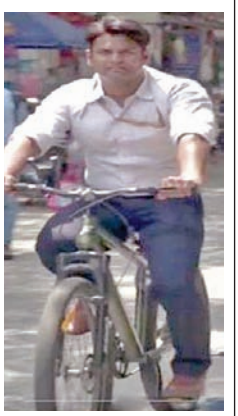
న్యూఢిల్లీ, మే 13: పశ్చిమానీయల్లో ఉద్దికల కారణంగా ప్రపంచ వ్యాప్తంగా నెలకొన్న ఇంధన సంక్షోభం నేపథ్యంలో పెట్రోల్, డీజిల్ వాడకాన్ని తగ్గించి దేశానికి సహకరించాలంటూ ప్రధాని నరేంద్ర మోడీ ఇచ్చిన పిలుపు క్షేత్రస్థాయిలో సానుకూల ప్రభావం చూపుతోంది. ఈ పిలుపుతో స్వార్థిపొందిన జిఎస్టీలకు డివైజులను సరేంద్ర మోడీ, తన విలాసవంతమైన కారును వక్రస్పెక్టి ఆఫీసుకు సైకిల్పై వెళ్లడంపై ఆసక్తి వ్యక్తం చేశారు. ప్రస్తుతం దేశం అంతర్జాతీయంగా పలు సవాళ్లను ఎదుర్కొంటోందని, ఇలాంటి సమయంలో ప్రతి పౌరుడు దేశ హితం కోసం ప్రయత్నించేయడం బాధ్యత అని నరేంద్రమోడీ పేర్కొన్నారు. సైకిల్ కేవలం వర్తమానకావాలేమీ కాదు అంటూ ప్రకటించారు. శారీరక దృఢత్వాన్ని కాపాడుకోవడానికి కూడా ఎంతో ఉత్తమమైనది. ఇంధనాన్ని పొదుపు చేయాలన్న ప్రధాని పిలుపును దృష్ట్యా అందరినీ, నాకు సైకిల్ ఉత్తమమైన మార్గంగా అనిపించిందని ఆయన అన్నారు.