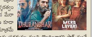
దురంధర్ కు దీటుగా వచ్చిన మేరా ల్యాల్ ఘోరంగా విఫలం

కూడి, మే 13: భారత సినిమాకు దీటుగా సమాధానం చెప్పాలనే లక్ష్యంతో పాకిస్థాన్ లో రూపొందించిన ఓ చిత్రం బాక్సాఫీస్ వద్ద ఘోరంగా విఫలమైంది. అధిష్టత దర్శకత్వంలోని భారతచిత్రం దురంధర్ కు ప్రతిస్పందనగా వచ్చిన మేరా ల్యాల్ అనే ఈ సినిమాకు ప్రేక్షకులనుంచి కనీస ఆదరణ కూడా లభించలేదు. కొన్ని థియేటర్లలో కేవలం 22 టికెట్లు మాత్రమే అమ్ముడయ్యాయని, దీంతో డోలారు రద్దు చేసి సినిమాను ప్రదర్శన నుంచి తొలగించాలని పాక్ సుంపే కేంద్రం వస్తున్నాయి. కరాచీలోని ల్యాల్ ప్రాంతాన్ని ఉగ్రవాద కార్యకలాపాలతో ముడిపెట్టి భారత చిత్రం దురంధర్ లో చూపించాలని, దానికి భిన్నంగా ఆ ప్రాంత సానుకూల కోణాన్ని ముఖ్యంగా మహిళా ఫుటిబాల్ క్రీడను ప్రమోదించే పరిచయం చేసి ఉద్దేశంతో మేరా ల్యాల్ ని తెరకెక్కించారు. ఈ నెల 8న విడుదలైన ఈ సినిమా మొదటిరోజే తేలిపోయింది.