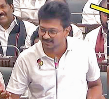
రాల్ ది గుర్తుచేశారు. తప్పుడు హామీలతో విజయ్ ఎన్నికల్లో గెలిచారని, ఆయన ఇచ్చిన ఎన్నికల హామీలపై ఆయననే స్పష్టత లేదని ఎద్దేవా చేశారు.

చెన్నై, మే 13: తమిళనాడు అసెంబ్లీలో బలపరీక్ష సందర్భంగా అధికార టివికె, ప్రతిపక్ష డిఎంకే మధ్య మాటల యుద్ధం తారస్థాయికి చేరింది. ఉదయనిధి స్టాలిన్ చేసిన రీల్ వర్సస్ రియల్ వ్యాఖ్యలు ఇప్పుడు రాజకీయవర్గాల్లో హాట్ టాపిక్ గా మారాయి. ముఖ్యమంత్రి విజయ్ ప్రభుత్వాన్ని లక్ష్యంగా చేసుకుని డిఎంకే శాసన సభాపక్ష నేత ఉదయనిధి స్టాలిన్ విమర్శనాస్త్రాలు సంధించారు. తమిళనాడుకు కావాలింది రియల్ ప్రభుత్వమే కాని, సినిమాల్లో కనిపించే రీల్ ప్రభుత్వం కాదని, విజయ్ పార్టీని రాష్ట్రంలోని 65 శాతం మంది ఓటర్లు తిరస్కరించారని, టివికె ప్రజలకు విశ్వాసం లేదనే విషయం ఎన్నికల్లోనే తేలిపోయిందని అన్నారు. టివికెకు మ్యూజీ ఫిగర్ కూడా