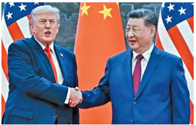
గురువారం జిఎంఓలో చైనా అధ్యక్షుడు జిన్ పింగ్ తో భేటీ అయిన డోనాల్డ్ ట్రంప్

అయితే, ముంబై ప్రభావిత ప్రాంతాలైన హిమా చల్ ప్రదేశ్, జమ్మూ కశ్మీర్, లద్దాఖ్ ప్రాంతాల్లో వాతావరణాన్ని దృష్టిలో ఉంచుకుని ఎన్ఎఆర్ పెడవ్యాప్తం తర్వాత ప్రకటిస్తామని పేర్కొంది. ఎన్ఎఆర్ మూడో దశలో భాగంగా 3.94 లక్షల మందికి పైగా బాత్ స్నాయి అధికారులు (ఓఎంఓ) ఇంటింటికీ వెళ్లి దాదాపు 36.73 కోట్ల మంది ఓటర్ల వివరాలను పరిశీలించనున్నారు. వీరికి రాజకీయ పార్టీలు నియమించిన 3.42 లక్షల బాత్ లెవల్ ఏజెంట్లు (ఓఎంఓ) సహాయం చేసే న్నారు. అయితే, ఓటర్ల జాబితా సవరణ ప్రక్రియ ఓటర్లకు తెలియజేయాలి. ఓటర్లకు తెలియ పార్టీలు ప్రతి పోలింగ్ బూత్ కు తప్పని >>2