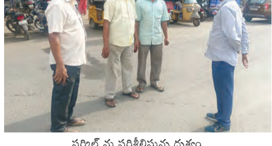
సర్కిల్ ను పరిశీలిస్తున్న దృశ్యం