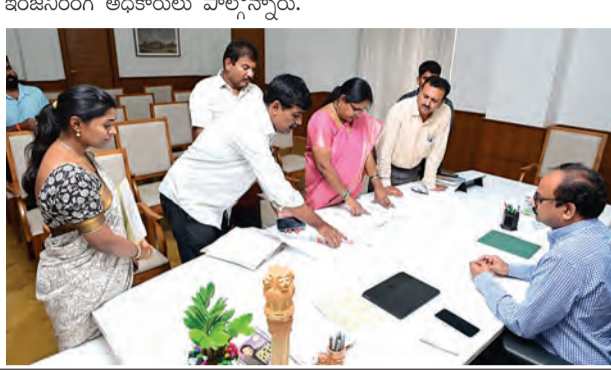
ఎన్టీఆర్ విగ్రహ ఏర్పాటుకై కమిషనర్ తో చర్చిస్తున్న కూటమి నాయకులు