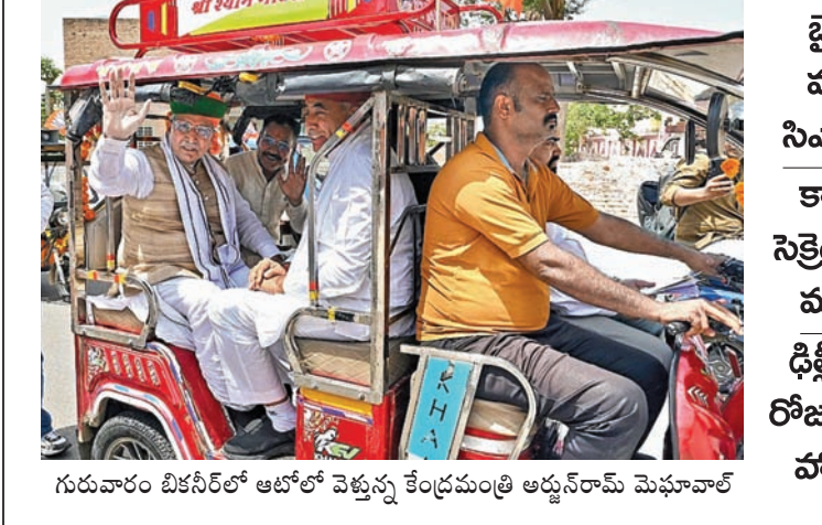
గురువారం బికనీర్ లో ఆకోలో వెళ్తున్న కేంద్రమంత్రి అర్జున్ రామ్ మెఘావాల

మోడీ ఫెయిల్ నీట్ రద్దు కేంద్ర ప్రభుత్వ వైఫల్యానికి నిదర్శనం ఆయన హయాంలోనే 93 పేపర్లు లీక్ అయ్యాయి ఆందోళనలో 2 కోట్ల మంది విద్యార్థులు ఆ మంత్రిపై ఎందుకు చర్చలేవు? కేంద్రం తీరుపై సిఎం రేవంత్ ఆగ్రహం