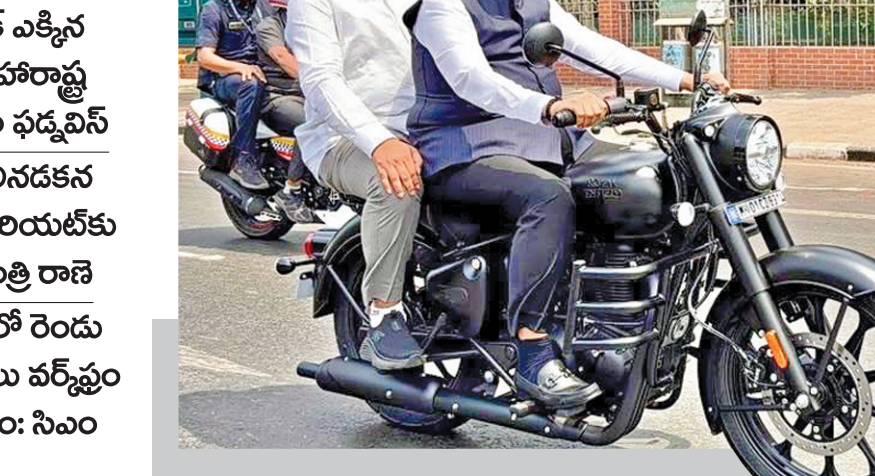
బైక్ ఎక్కిన మహారాష్ట్ర సిఎం ఫడ్డవిస్ కాలినడకన సైక్లెట్ రియల్ కు మంత్రి రాణి ధీల్లీలో రెండు రోజులు వర్షం వాం: సిఎం

పాదుపు మంత్రం! ముంబయి, మే 14: మహారాష్ట్ర ముఖ్యమంత్రి దేవేంద్ర ఫడ్డవిస్ గురువారం ఆంధ్రపీఠం ఆశ్రయం వహించారు. ఆయన తన అధికారిక నివాసం నుంచి విమానం భవన్ కు బయట ప్రయాణించారు. ఇంధనాన్ని ఆదా చేయాలన్న ప్రధానమంత్రి ఆదేశంపై మోడీ పిలుపు మేరకు, ఫడ్డవిస్ ఈ విధంగా తన వంటకాన్ని అమలుచేశారు. గురువారం జరిగిన శాసనసభలో సభ్యుల ప్రమాణ స్వీకార కార్యక్రమానికి హాజరయ్యేందుకు, ఫడ్డవిస్ బీజేపీ నేత, మంత్రి అశ్వినీ