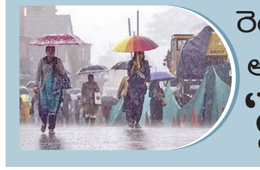
రెండు రోజుల్లో అండమాన్ కు 'నైరుతి'

ప్రభావవర్తి ప్రధాన ప్రతినిధి, హైదరాబాద్, మే 14: కేంద్ర ఎన్నికల సంఘం ఓటర్ల జాబితా ప్రత్యేక సవరణ (ఎన్ఐఎ-నర్) మూడో దశకు సంబంధించి కీలక ప్రకటనలు వెలువరించింది. ఆంధ్రప్రదేశ్, తెలంగాణ సహా 16 రాష్ట్రాలు, మూడు కేంద్రపాలిత ప్రాంతాల్లో మే 30 నుంచి దశలవారీగా చేపట్టిన సున్నట్ల గురువారం