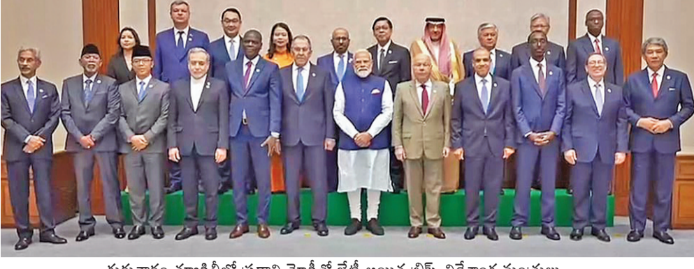
గురువారం న్యూఢిల్లీలో ప్రధాని మోడీతో భేటీ అయిన బ్రిక్స్ విదేశాంగ మంత్రులు

న్యూఢిల్లీ, మే 14: దేశ రాజధాని ఢిల్లీ వేదికగా బ్రిక్స్ సమావేశం జరగుతుంది. భారత్ విదేశాంగ మంత్రి డాక్టర్ విదేశాంగ మంత్రుల సమావేశం కొనసాగుతోంది. ఎన్ జైజింగర్ ఈ సమావేశానికి అధ్యక్షత వహిస్తారు. గురువారం, శుక్రవారం రెండు రోజులపాటు ఈ బ్రిక్స్ సభ్య దేశాలు, భాగస్వామ్య దేశాల ప్రతినిధులు