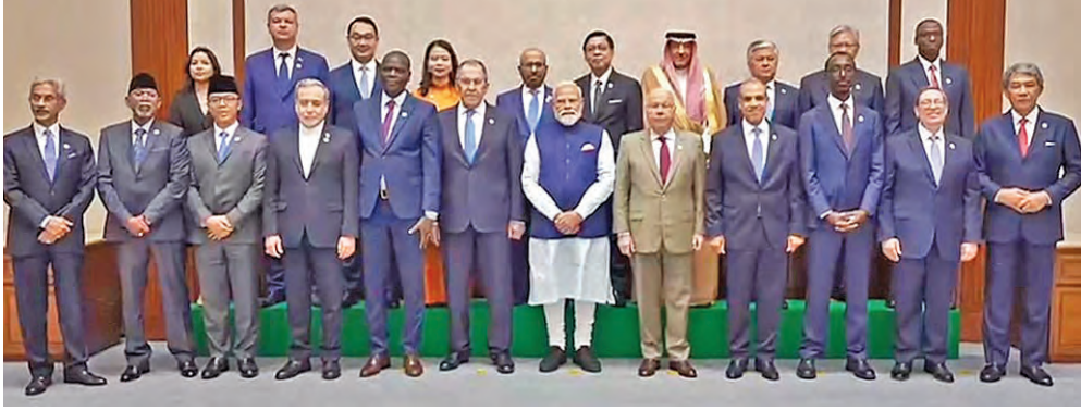
గురువారం న్యూఢిల్లీలో ప్రధాని మోడీతో భేటీ అయిన బ్రిక్స్ విదేశాంగ మంత్రులు

న్యూఢిల్లీ, మే 14: దేశ రాజధాని ఢిల్లీ వేదికగా బ్రిక్స్ విదేశాంగ మంత్రుల సమావేశం కొనసాగుతోంది. గురువారం, శుక్రవారం రెండు రోజులపాటు ఈ బ్రిక్స్ సభ్య దేశాలు, భాగస్వామ్య దేశాల ప్రతినిధులు సమావేశం జరగుతుంది. భారత విదేశాంగ మంత్రి డాక్టర్ ఎన్ జైశంకర్ ఈ సమావేశానికి అధ్యక్షత వహిస్తున్నారు.