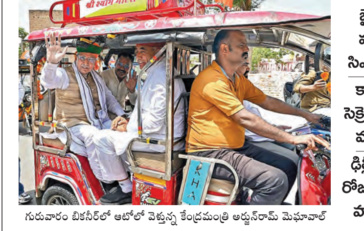
గురువారం బీకెసీఆర్ ఆటోలో వెళ్తున్న కేంద్రమంత్రి అర్జున్ రామ్ మెఘావాలే

మోడీ ఫెయిల్ నీట్ రద్దు కేంద్ర ప్రభుత్వ వైఫల్యానికి నిదర్శనం ఆయన హయాంలోనే 93 పేపర్లు లీక్ ఆందోళనలో 2 కోట్ల మంది విద్యార్థులు ఆ మంత్రిపై ఎందుకు చర్చలేవు? కేంద్రం తీరుపై సిఎం రేవంత్ ఆగ్రహం ప్రభాతవార్త ప్రధాన ప్రతినిధి, హైదరాబాద్, మే 14: నీట్ యూజీ 2026 రద్దు... మోడీ ప్రభుత్వ నియంతృత్వం... నిరంకుశ నిర్ణయమని తెలంగాణ ముఖ్యమంత్రి ఎ. రేవంత్ రెడ్డి విమర్శించారు. కేంద్ర ప్రభుత్వ ఏకపక్ష రద్దుతో యువత భవిష్యత్తుపై తీవ్ర ప్రభావం పడుతుందన్నారు. గత పదేళ్లుగా ప్రధాని మోడీ హయాంలో 93 పేపర్లు లీక్ అయ్యాయని ఆగ్రహం వ్యక్తం చేశారు. దీంతో రెండు కోట్ల మంది విద్యార్థులు ఆందోళన చెందుతున్నారని అన్నారు. పేపర్ లీక్ జరిగితే కనీసం సంబంధిత మంత్రిపై ఎటువంటి చర్యలు తీసుకోలేదని ముఖ్యమంత్రి విమర్శించారు. నీట్ రద్దు... దేశ ప్రజలను తీవ్ర దిగ్భ్రాంతికి గురి చేసిన పెద్ద నోట్ల రద్దు వంటిదేనని అన్నారు. కేంద్ర ప్రభుత్వ అసాధారణ, నిరక్షమైన ప్రభుత్వం దేశ యువత భవిష్యత్తును ప్రశ్నార్థకం చేసిందన్నారు. వ్యవస్థాత్మకంగా పేపర్ లీక్, ప్రభుత్వ వైఫల్యాలు దేశ యువతను తీవ్ర అనిశ్చితి, నిరాశలోకి నెట్టాయని చెప్పారు. తీవ్ర ఒత్తిడిలో సంవత్సరాల తరబడి కష్టపడి చదువుకున్న విద్యార్థుల కలలు మోడీ ప్రభుత్వ నిరక్షమైన కారణంగా ప్రస్తుతం కల్లలయ్యాయని ఆందోళన వ్యక్తం చేశారు. ఎంతో మంది విద్యార్థుల తల్లిదండ్రులు అప్పులు చేసి, కొంతమంది పేరెంట్స్ నగలు అమ్మి తమ పిల్లలను నీట్ ఎగ్జామ్ కు ప్రేరేపించారు. వారి ఆశలన్నీ గల్లంతవడం బాధాకరమన్నారు. 2019 నుండి 15 రాష్ట్రాల్లో ప్రధాన నియో