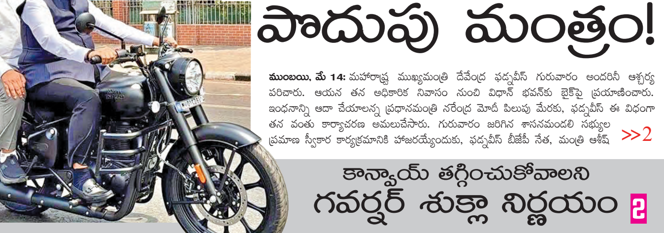
కాన్వాయ్ తగ్గించుకోవాలని గవర్నర్ శుక్లా నిర్ణయం

బైక్ ఎక్కిన మహారాష్ట్ర సిఎం ఫడ్కవీస్ కాలినడకన సెక్యూరిటీకు మంత్రి రాణి ధీల్లీలో రెండు రోజులు వర్షం వహించి: సిఎం