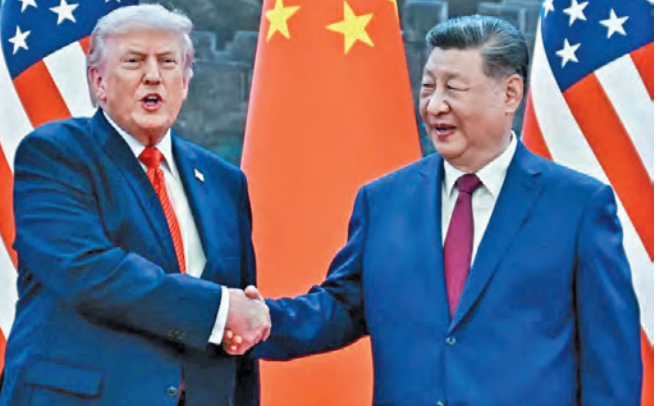
గురువారం జిజిఎంఐ చైనా అధ్యక్షుడు జిన్ పింగ్ తో భేటీ అయిన డోనాల్డ్ ట్రంప్

అయితే, మంజు ప్రభావిత ప్రాంతాలైన హిమాచల్ ప్రదేశ్, జమ్ము కశ్మీర్, లద్దాఖ్ ప్రాంతాల్లో వాతావరణాన్ని దృష్టించి కుంకుని ఎస్ఎఆర్ షెడ్యూల్ ను తర్వాత ప్రకటిస్తామని పేర్కొంది. ఎస్ఎఆర్ మూడో దశలో భాగంగా 3.94 లక్షల మంది పైగా బాక్ స్టాంపు అధికారులు (ఓఎంఓ) ఇంటింటికీ వెళ్లి రాజకీయ సంబంధం ఉన్న ఓటిల్ల వివరాలను పరిశీలించనున్నారు. వీరికి రాజకీయ పార్టీలు నియమించిన 3.42 లక్షల బాక్ లెవల్ ఎంపిలు (ఓఎంఓ)లు సహాయం చేస్తారు. అయితే, ఓటిల్ల జాబితా సవరణ ప్రక్రియ పారదర్శకంగా ఉండేందుకు రాజకీయ పార్టీలు ప్రతి పోలింగ్ బూత్ కు తప్పని >>2