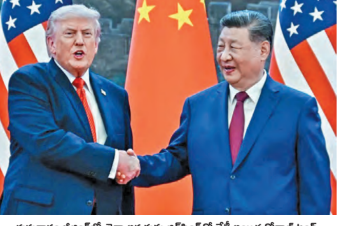
గురువారం జింగోలో చైనా అధ్యక్షుడు జిన్ పింగ్ తో భేటీ అయిన డోనాల్డ్ ట్రంప్