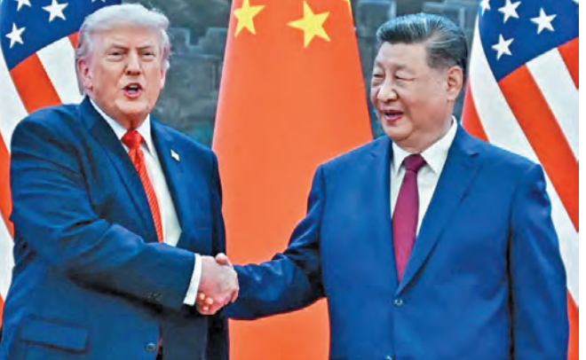
గురువారం జిజిఎంకో చైనా అధ్యక్షుడు జిన్ పింగ్ తో భేటీ అయిన డోనాల్డ్ ట్రంప్