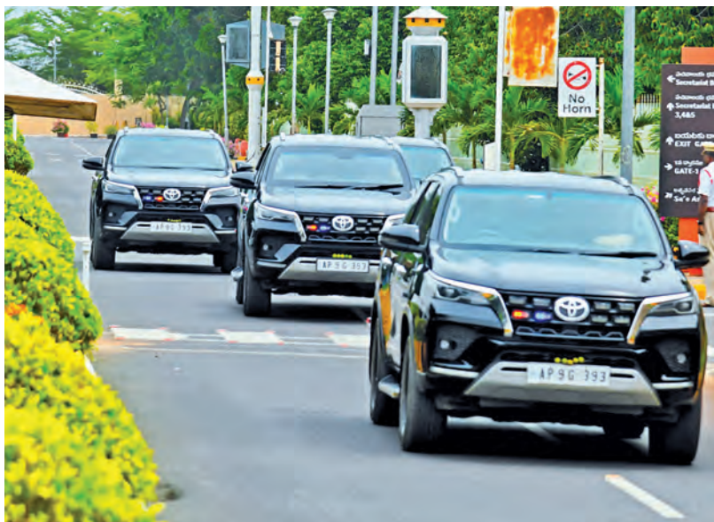
గురువారం కుదిరిన సిఎం చంద్రబాబు కాన్యాడ్యం

సిఎం చంద్రబాబు వాహన శ్రేణి కుదిరింది ప్రధాని మోడీ పిలుపుతో కాన్యాడ్యం తగ్గించుకున్న ముఖ్యమంత్రి