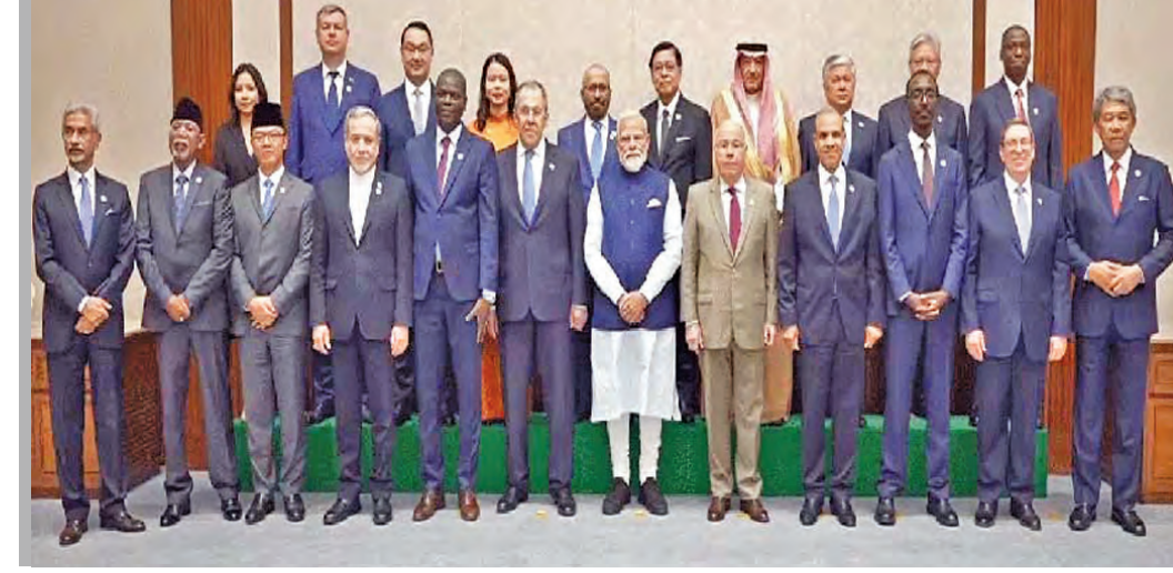
గురువారం న్యూఢిల్లీలో ప్రధాని మోడీని మర్యాదపూర్వకంగా కలిసిన బ్రిక్స్ విదేశాంగ మంత్రులు

కోవడం సాధ్యం కావడంపట్టు, ఇక నాగార్జున సాగర్ పరిస్థితి కూడా ఏమంతా ఆశాజనకంగా లేదు. 312.05 టీఎంసీల సామర్థ్యం ఉన్న ఈ ప్రాజెక్టులో ప్రస్తుతం 157.42 టీఎంసీలు నీటి నిల్వలో ఉన్నాయి.