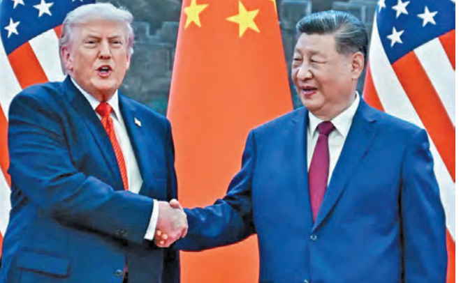
గురువారం జిజిఎంఐ చైనా అధ్యక్షుడు జిన్ పింగ్ తో భేటీ అయిన డోనాల్డ్ ట్రంప్

అడుగంటిన శ్రీశైలం, సాగర్ డెడ్ స్టోరేజీ చేరువలో జలాశయాలు హైదరాబాద్, మే 14, ప్రభాతవార్త: తెలుగు రాష్ట్రాల జీవనాడి కృష్ణా మైలువలను తోంది. ఎండలు మండిపోతుండటంతో ప్రాజెక్టుల్లో నీటిమట్టం రోజురోజుకూ పాతాళానికి పడిపోతోంది. అటు శ్రీశైలం, జటు నాగార్జున సాగర్ జలాశయాల్లో నీరు అడుగంటిపోవడంతో రానున్న రోజుల్లో తాగునీటి కష్టాలు తప్పవన్న అందోళన మొదలైంది. శ్రీశైలం ప్రాజెక్టు దాదాపు ఖాళీ అవుతోంది. ఈ ద్వారా పూర్తి నీటి నిల్వ సామర్థం 215.81 టీఎంసీలు కాగా ప్రస్తుతం కేవలం 39.2 టీఎంసీలు మాత్రమే ద్వారంలో మిగిలి ఉన్నాయి. ప్రాజెక్టుకు సంబంధించి 810 అడుగుల వద్ద నీటిమట్టాన్ని డెడ్ స్టోరేజీగా పరిగణిస్తారు. అయితే ప్రస్తుతం నీటిమట్టం 81.7 అడుగుల దగ్గర ఉంది. అంటే మరో 7 అడుగులు తగ్గితే నీటిని వినియోగించు >>2