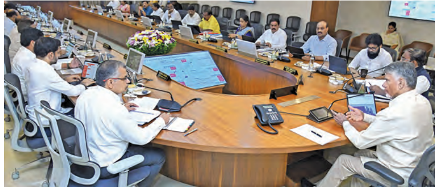
గురువారం సీఎం చంద్రబాబు అధ్యక్షతన జరిగిన రాష్ట్ర మంత్రి మండలి సమావేశం దృశ్యం

రూ. రెండు లక్షల కోట్ల పెట్టుబడులతో ఏర్పాటు తిరుపతిలో రూ. 2,500 కోట్లతో రాయల్ ఎన్ ఫీల్డ్ విశాఖలో లక్ష కోట్లతో లలయన్స్ డేటా సెంటర్ అగ్రిగేట్ కేసుపై ముగ్గురు సభ్యులతో కమిటీ మంత్రి మండలి కీలక నిర్ణయాలు