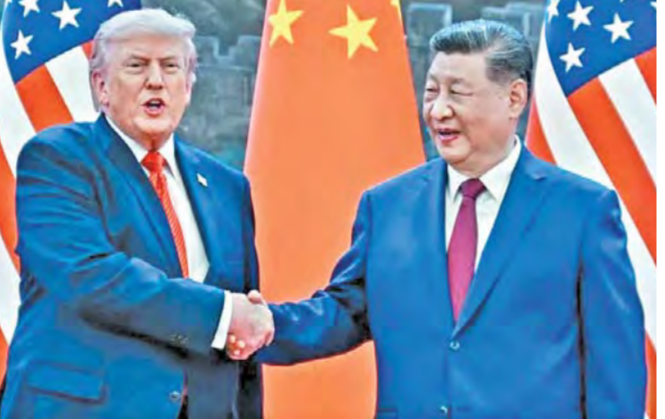
గురువారం జింగోలో చైనా అధ్యక్షుడు జిన్ పింగ్ తో భేటీ అయిన డోనాల్డ్ ట్రంప్

ప్రభాతవార్త ప్రధాన ప్రతినది, హైదరాబాద్, మే 14: కేంద్ర ఎన్నికల సంఘం ఓటిల్ల జాబితా ప్రత్యేక సవరణ (ఎన్ఎలెఆర్-సర్) మూడో దశకు సంబంధించి కీలక ప్రకటన వెలువరించింది. ఆంధ్రప్రదేశ్, తెలంగాణ సహా 16 రాష్ట్రాలు, మూడు కేంద్రపాలిత ప్రాంతాల్లో మే 30 నుంచి దశలవారీగా చేపట్టనున్న గురువారం తెలిపింది. ఢిల్లీ, ఒడిశా, అంధ్రప్రదేశ్, అరుణాచల్ ప్రదేశ్, హర్యానా, చండీగఢ్, తెలంగాణ, పంజాబ్, కర్ణాటక, మేఘాలయ, మహారాష్ట్ర, రూరల్, నాగాలాండ్, త్రిపుర, దాద్రా-నగర్ హవేలి, డామన్ డయ్యూల్లో మూడో దశ ఎన్ఎలెఆర్ ప్రక్రియ జరిగనుంది. >>2