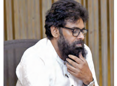
ప్రమాద సానుభూతి తెలియజేస్తున్నారన్నారు. క్షతగాతులకు మెరుగైన వైద్య సాయం అందించాలని కాకినాడ జిల్లా యంత్రాంగానికి సూచించామని, వారు పూర్తిగా కోలుకునే వరకు ప్రభుత్వం తరఫున అన్ని విధాలా అందగా నిలుస్తామని

విజయవాడ,మే 16 ప్రభాతవార్త ప్రతినిధి: కాకినాడ రూరల్ మండలం పరిధిలో పని ప్రదేశంలో రోడ్డు దాటుతున్న సమయంలో జరిగిన రోడ్డు ప్రమాదంలో నలుగురు మహిళా ఉపాధి శ్రామికులు మృతి చెందారన్న విషయం తెలిసి దిగ్భ్రాంతికి గురయ్యారు. టిడిగ గ్రామానికి చెందిన అందగురు మహిళా శ్రామికులు రోడ్డు దాటుతున్న సమయంలో వేగంగా వచ్చిన టిప్పర్ ట్రైల్లో పట్టడం వల్ల ఈ ప్రమాదం జరిగినట్లు అధికారులు తెలియజేశారు. పని ప్రదేశంలో ఇలాంటి సంఘటన వోటు చేసుకోవడం తీవ్రంగా కలచి వేసింది. ప్రమాదంలో మృతి చెందిన వారి కుటుంబాలకు మహిళా శ్రామికులు రోడ్డు దాటుతున్న సమయంలో వేగంగా వచ్చిన టిప్పర్ ట్రైల్లో పట్టడం వల్ల ఈ ప్రమాదం జరిగినట్లు అధికారులు తెలియజేశారు. పని ప్రదేశంలో ఇలాంటి సంఘటన వోటు చేసుకోవడం తీవ్రంగా కలచి వేసింది. ప్రమాదంలో మృతి చెందిన వారి కుటుంబాలకు