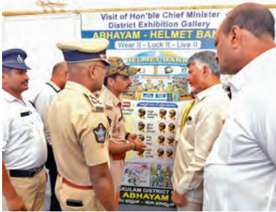
బ్యాంకు కార్యక్రమం లక్ష్యాలు, అమలు విధానం గురించి వివరాలు వివరించారు. రోడ్డు ప్రమాదాల నివారణ మరియు ద్వితీయ వాహనదారుల్లో హెల్మెట్ వినియోగంపై అవగాహన పెంపొందించేందుకు ఈ కార్యక్రమాన్ని ప్రారంభించినట్లు తెలిపారు. హెల్మెట్ లేకుండా ప్రయాణిస్తున్న వాహనదారులను గుర్తించి తాత్కాలికంగా హెల్మెట్ అందజేస్తామని, వారు 48 గంటలలోపు సస్యంగా కొత్త హెల్మెట్ కొనుగోలు చేసి హెల్మెట్ బ్యాంకుకు తిరిగి అందజేసే విధంగా కార్యక్రమాన్ని అమలు చేస్తున్నట్లు వివరించారు. ఈ విధానం ద్వారా ప్రజల్లో బాధ్యతాయుతమైన హెల్మెట్ డ్రైవింగ్ అలవాటు మరియు భద్రతా చైతన్యం పెరుగుతుందని తెలిపారు. ఈ తీరుపై