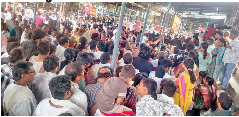
ఆలయం వద్ద నిరీక్షిస్తున్న భక్తులు

శ్రీకాళహస్తి, మే 16 ప్రభాతవార్త: తిరుపతి జిల్లాలోని ప్రముఖ పుణ్యక్షేత్రం శ్రీకాళహస్తిశ్వరాలయాలికి రెండు రోజులుగా భక్తులు కదలి వస్తున్నారు. ఓ వైపు అమావాస్య, కిరీక కావలంతో శనివారం ఆలయం కిట కిట లాడింది. వేసవి కాలం తమిళనాడులో ఎన్నికలు ముగియడంతో ఆలయానికి భక్తులు తండోపతండోలుగా వస్తున్నారు. ఈ సేవధ్యంలో శనివారం ఆలయం భక్తులతో కిక్కిరిసింది. ఎటు మాసినా భక్త జనమే. ఎటు చూసినా వాహనాల రద్దయే కనబడింది. వరద సెలవులతో జిల్లాలోని ఆలయాలు కిట కిట లాడుతున్నాయి. ఓ వైపు ఎండ మాడు వగల గొవతున్నా, లెక్క చేయక భక్తులు కదలి వస్తున్నారు. దాంతో వాయులింగేశ్వరుని దర్శనం కోసం భక్త జనలు సతతమయ్యారు. అయితే ఆలయానికి ఒకే రోజు రూ.కోటి ఆదాయం వచ్చింది. ఒక రాహుకేతుడోప నివారణ పూజలు కిటలు జరగటం గత రెండు సంవత్సరాల్లో ఇదే మొదటి సారి, ఇక శనిశ్వరాభిషేకాలు కూడా సుమారు 600 జరగటం గమనించడం విషయం తండోపతండాలుగా భక్తులు: శ్రీకాళహస్తిశ్వరాలయంలో నిర్వహించే రాహుకేతుడోప నివారణ పూజలకు విశేష స్పందన లభిస్తుంది. దేశ విదేశాల నుంచి వేల సంఖ్యలో భక్తులు వస్తున్నారు. అయితే ఇక్కడకు వచ్చిన భక్తుల సమస్యలు వచ్చిన తరువాత కానీ అర్ధం కావటం లేదు. ముఖ్యంగా శని, ఆదివారం రాత్రి వచ్చే భక్తుల సంఖ్యను బట్టి ఇక్కడి లాడ్జి