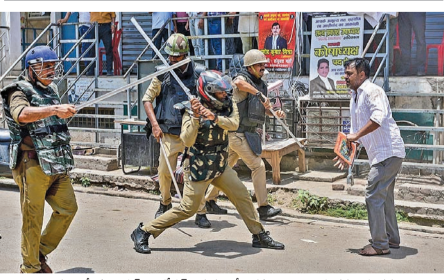
అదివారం లక్నో ముస్లిం పల్ కాల్పొరషన్ ఆధ్వర్యంలో ఆక్రమణల తొలగించు చర్యల సందర్భంగా నిరసన తెలిపే వ్యక్తిపై లాఠీ ఛార్జ్ చేస్తున్న పోలీసులు