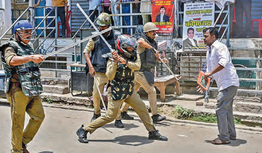
ఆదివారం అక్కి ముస్లి పల్ కార్పొరేషన్ ఆధ్వర్యంలో ఆక్రమణల తొలగింపు చర్యల సందర్భంగా నిరసన తెలిపే వ్యక్తిలై లాభి ఛార్జ్ చేస్తున్న పోలీసులు