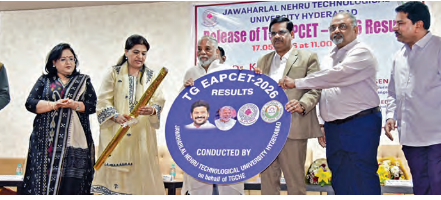
ఆదివారం ఎంపీసెట్ ఫలితాలను విడుదల చేస్తున్న కేవలం వార్త. చిత్రంలో విద్యాశాఖ అధికారులు