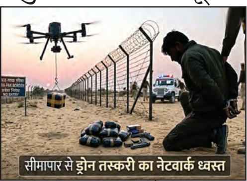
सीमापार से ड्रोन तस्करी का नेटवर्क ध्वस्त

इस पूरे इंटरनेशनल सिंडिकेट के बेनकाब होने की कहानी इस साल फरवरी महीने से जुड़ी है। फरवरी में पाकिस्तानी