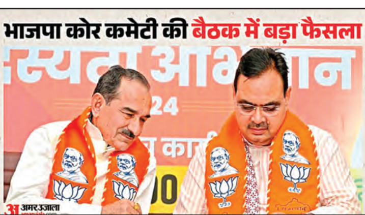
भाजपा कोर कमेटी की बैठक में बड़ा फैसला

बैठक में नीट परीक्षा प्रकरण पर भी चर्चा हुई। भाजपा नेताओं ने कांग्रेस पर इस मुद्दे का राजनीतिकरण करने का आरोप लगाया। डॉ. चतुर्वेदी ने कहा कि परीक्षा में अनियमितताओं की