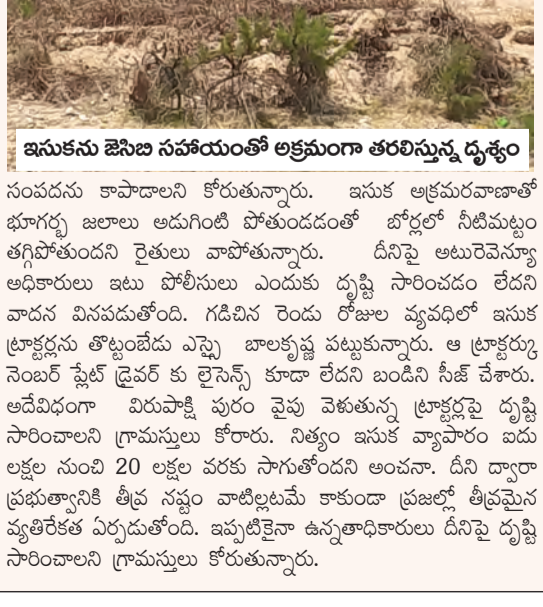
ఇసుకను జైబి సహాయంతో అక్రమంగా తరలిస్తున్న దృశ్యం