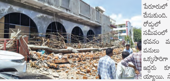
పేరురాలి స్టాబ్ కూలి

తిరుపతిరూరల్ మండలం ప్రమాదకర ఘటన చోటు చేసుకుంది. తిరుపతి-చంద్ర గిరి రోడ్డులో పేరురాలి బస్ స్టాబ్ సమీపంలో పాత హీల్ బ్రాండ్ భవనం ముందు భాగాన వరండా పనులు చేస్తున్న సమయంలో ఒక్కసారిగా స్టాబ్ కూలిపోవడంతో ఇద్దరు కార్మికులు తీవ్ర గాయాలయ్యాయి. స్థానికులు తెలిసిన వివరాల మేరకు ఆదివారం భవన నిర్మాణ ముందు వరండా పనులు చేస్తుండగా ఒక్కసారిగా స్టాబ్ కూలడంతో ఒరిస్సాకు చెందిన ఇద్దరు కార్మికులు శిథిలాల కింద చిక్కుకున్నారు. ప్రమాదాన్ని గమనించిన స్థానికులు వెంటనే స్పందించి గాయపడినవారిని బయటకు తీసి అంబులెన్స్ లో తిరుపతి రుయా హాస్పిటల్ కు తరలించారు. ఘటనపై సమాచారం అందుకున్న తిరుపతిరూరల్ పోలీసులు వెంటనే సంఘటనా స్థలానికి చేరుకుని పరిస్థితిని పరిశీలించారు. ఈ ఘటనపై పోలీసులు కేసు నమోదు చేసి దర్యాప్తు చేస్తున్నారు. వరండా నిర్మాణ పనులలో భగవంతుల ప్రమాణాలు పాటించడంలో స్టాబ్ కూలిపోవడం గురించారు. ఇలాంటి ఘటన పునరావృతం కాకుండా చూడాలని స్థానికులు కోరుతున్నారు.