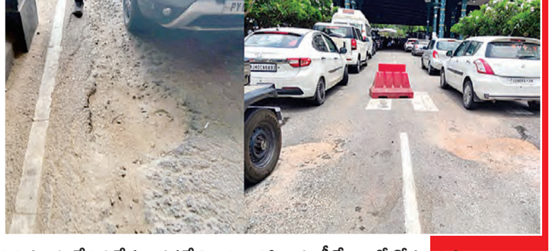
తిరుమలకు చేరుకునే ప్రధాన ప్రవేశద్వారం అలిపిరి తనకీ కేంద్రంలో రోడ్డునిర్మాణం అధ్యాపకం తయారయ్యాయి. దేశవిదేశాల నుండి వస్తున్న యాత్రికుల నుండి టోల్ ఫీజు వసూలుచేస్తున్న టిటిడి భక్తుల సౌకర్యాలను మరచింది. రెండు అలిపిరి టోల్ గేట్లలో ముందే రోడ్డుదెబ్బతిని గుంతలయంగా మారాయి. వాహనాలు దిగకముందే భక్తులకు గుంతల కచ్చెలు సాగజతమిస్తున్నాయి. టిటిడి అధికారులు ఈ రోడ్డును బాగుచేయడమే ఆలస్యం.