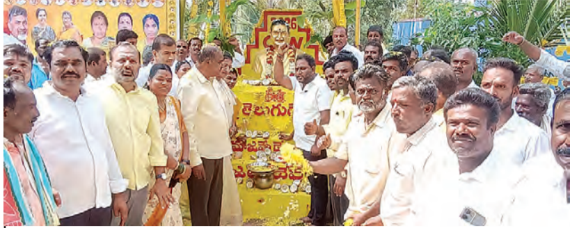
ప్రజల్లో రాజకీయ చైతన్యం తెచ్చిన వ్యక్తి నందమూరి తారక రామారావు అని ప్రభుత్వ విప్ డాక్టర్