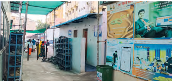
సిఆర్ఓ కార్యాలయం పక్కన చెప్పుల స్టాండ్లు

అసలే ఇరుకు సందు: పక్కనే చెప్పుల స్టాండ్ - ముగుగునీరు తొక్కుకుంటూ భక్తుల అవస్థలు!