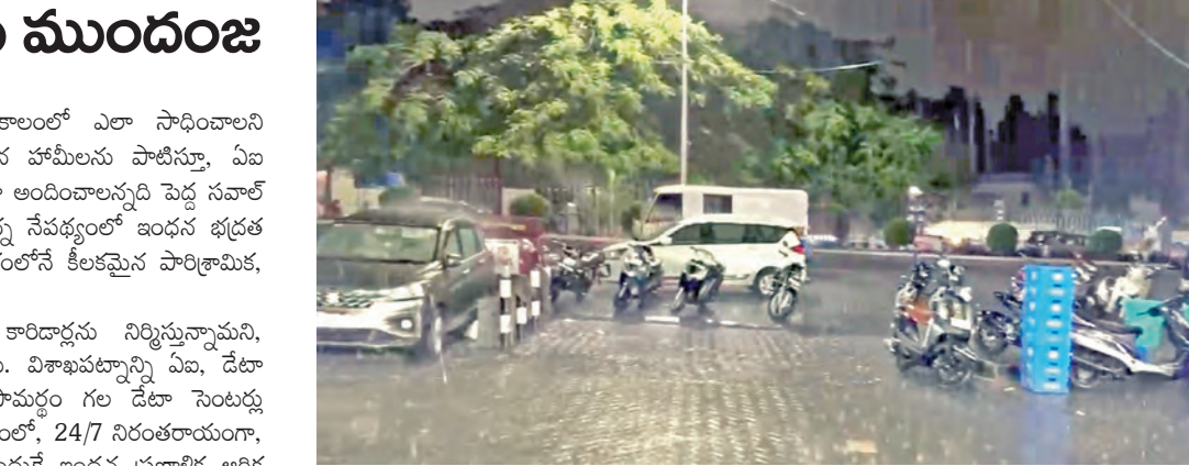
సోమవారం రాత్రి తిరుమలలో కురిసిన భారీ వర్షం