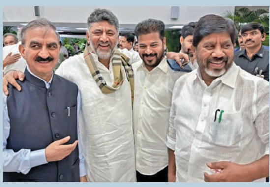
తిరువనంతపురంలో సీఎం సతీశ్ ప్రమాణి స్వీకారానికి హాజరైన సీఎం కేసరి, డి.సి.ఎం భట్ల, కర్ణాటక డి.సి.ఎం శివకుమార్