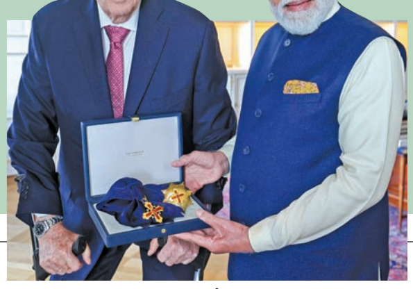
సోమవారం ఓస్లోలో ప్రధాని మోడీకి గ్రాండ్ క్రాస్ ఆఫ్ రాయల్ నార్వేజియన్ ఆర్డర్ ను ప్రధానం చేస్తున్న నార్వే రాజు హెరాల్డ్ వి

భారత్, నార్వే మధ్య 100 బిలియన్ డాలర్ల ద్వైపాక్షిక వాణిజ్యం నార్వే ప్రధాని జోనాస్ గర్ స్టోర్తో ప్రధానిమోడీ భేటీ