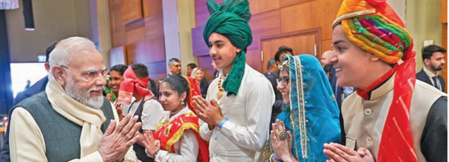
సోమవారం ఓన్ లో ప్రధాని మోడీ స్నానం వలకుతున్న కళాకారులు

ప్రజలకు ఆయనే కంపెనీల విజ్ఞప్తి హైదరాబాద్, మే 18, ప్రభాతవార్త: రాష్ట్రంలో పెట్రోల్, డీజిల్, ఎల్పీజి కోరక ఉండటా సాగుతున్న ప్రచారాన్ని ప్రభుత్వం చమరు కంపెనీలు స్పష్టపరిచాయి. రాష్ట్రంలో డిమాండ్ కు సరిపడా ఇంధన నిల్వలు అందుబాటులో ఉన్నాయని, ఎక్కడా ఎలాంటి కోరక లేదని ఓఎసీల రాష్ట్ర కో ఆర్డినేటర్ సోమవారం ఓ ప్రకటనలో స్పష్టం చేశారు. ఇంధన సరఫరాను నిరంతరం పర్యవేక్షిస్తున్నామని, రాజాహ సేవలను మరింత వేగవంతం చేసేందుకు అవసరమైన అన్ని చర్యలు తీసుకుంటున్నట్లు వెల్లడించారు. రాష్ట్రంలో ఇంధన వినియోగం గతంలో పోలిస్తే గణనీయంగా పెరిగినట్లు అయిల్ కంపెనీలు తెలిపాయి. ఈ నెల మొదటి 15 రోజుల్లోనే రికార్డు స్థాయి వుట్టి నమోదైంది. పెట్రోల్ సరఫరాలో 14.2 శాతం వృద్ధి, డీజిల్ సరఫరాలో 15.7 శాతం వృద్ధిని ఓఎసీలు నమోదు చేశాయి. డిమాండ్ ఎంత ఉన్నా సరఫరాకు ఎలాంటి ఇబ్బంది లేదని కంపెనీలు భరోసా ఇచ్చారు. ఇక వేసవిలో సమాధివృత్తుల అధిక ఉష్ణోగ్రతల కారణంగా గృహావసర ఎల్పిజి సిలిండర్ల బుకింగ్ కోరక తగ్గుముఖం పట్టినట్లు ఓఎసీలు తెలిపాయి. సాధారణంగా ఇలాంటి రోజుల్లో వినియోగదారులు అందోకనతో ముందస్తు బుకింగ్ చేయడానికి ఆసక్తి చూపించరని, ప్రస్తుత క్రింద ఈ సీజన్లో సాధారణమేనని తెలిపాయి. ఈ నెల 17 వరకు మొత్తం 20.06 లక్షల గృహావసర ఎల్పిజి సిలిండర్లను విజయవంతంగా డెలివరీ చేసినట్లు సంస్థ వెల్లడించింది. వినియోగదారులు గ్యాస్ బుకింగ్ కోసం ఇబ్బంది పడకుండా ఎంఎంఎస్, మిస్ కార్, ఐ.ఆర్.ఎస్, ఆన్ లైన్ వేదికల ద్వారా సులభంగా బుక్ చేసుకోవాలని కంపెనీలు సూచించాయి. ఈ సేవధ్యంలో సోషల్ మీడియాలో ఇంధన కోరకపై వచ్చే వందలలను నమ్మి సామాన్య ప్రజలు అందోకన చెందవచ్చని ఓఎసీలు విజ్ఞప్తి చేశాయి. కేవలం అధికారిక, విశ్వసనీయ సంస్థలు అందించే సమాచారాన్ని మాత్రమే నమ్మాలని ప్రజలను కోరాయి.