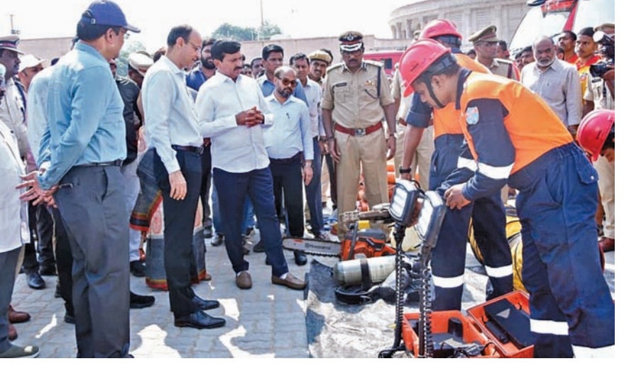
సోమవారం హైదరాబాద్ లో భారీ విపత్తు నిర్వహణ మాక్ డ్రైల్ పరిశీలించిన మంత్రి పాంగులేటి

ప్రపంచస్థాయి సాంకేతికతతో విపత్తు రక్షణ వ్యవస్థ బలోపేతం ప్రమాదాల సమయంలో 'గోల్డెన్ అవర్' కీలకం ముందస్తు సన్నద్ధత, శాఖల మధ్య సమన్వయం ఎంతో అవసరం మాక్ డ్రైల్, సమీక్షలో మంత్రి పాంగులేటి