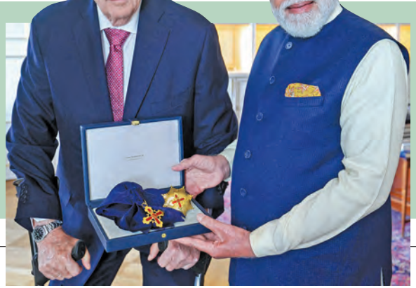
సోమవారం ఓస్లోలో ప్రధాని మోడీకి 'గ్రాండ్ ట్రాన్స్ ఆఫ్ రాయల్ నార్వేజియన్ ఆర్డర్'ను ప్రధానం చేస్తున్న నార్వే రాజు హెరాల్డ్ వి

భారత్, నార్వే మధ్య 100 బలియన్ డాలర్ల ద్వైపాక్షిక వాణిజ్యం నార్వే ప్రధాని జోనాస్ గర్ స్టోర్తో ప్రధాని మోడీ భేటీ