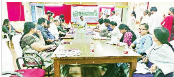
తదితర శాఖల అధికారులు పరస్పర సమన్వయంతో పని చేసి ప్రజల సమస్యలకు త్వరితగతిన పరిష్కారం చూపాలని ఆదేశించారు. ప్రజావాణిలో వచ్చే ప్రతి ఫిర్యాదుపై నిర్దిష్ట గడువులో నివేదిక సమర్పించాలని, పరిష్కార ప్రక్రియను పారదర్శకంగా నిర్వహించాలని తెలిపారు. ప్రజలకు ప్రభుత్వ సేవలు అందుబాటులోకి రావాలంటే అధికారులు ప్రజల పట్ల సేవాభావంతో పని చేయాలని, కార్యాలయాలకు వచ్చే ప్రతి ఒక్కరితో మర్యాదపూర్వకంగా వ్యవహరించాలని ఆర్డీఓ పేర్కొన్నారు. సమస్యల పరిష్కారంలో ఎలాంటి ఆలస్యం సహించబోమని హెచ్చరించారు. ఈ కార్యక్రమంలో డి.ఎ.ఓ పి.రాధతో పాటు వివిధ శాఖల అధికారులు, సిబ్బంది పాల్గొన్నారు

ప్రజావాణి కార్యక్రమానికి వచ్చే ప్రజల సమస్యలను అధికారులు అత్యంత ప్రాధాన్యతగా తీసుకుని సత్వరమే పరిష్కరించాలని ఆర్డీఓ కృష్ణారెడ్డి అధికారులను ఆదేశించారు. ప్రజల సమస్యల పరిష్కారమే ప్రభుత్వ ప్రధాన ధ్యేయమని, ప్రతి అర్జీపై సంబంధిత శాఖలు సమన్వయంతో పని చేసి బాధితులకు న్యాయం చేయాలని సూచించారు. సోమవారం ఆర్డీఓ కార్యాలయంలోని సమావేశ మందిరంలో నిర్వహించిన ప్రజావాణి కార్యక్రమంలో వివిధ మండలాలు, గ్రామాల నుంచి వచ్చిన ప్రజల నుంచి మొత్తం 17 వినతిపత్రాలను ఆర్డీఓ స్వీకరించారు. భూ వివాదాలు, పట్టణదారు పాసిబుక్లు, ఆదాయ, కుల ధ్రువపత్రాలు, సంక్షేమ పథకాల అమలు, పెన్షన్ల మంజూరు, ఉపాధి హామీ, రేషన్ కార్డులు, సాగునీటి సమస్యలు తదితర అంశాలపై ప్రజలు తమ సమస్యలను వినిపించారు. ప్రజల నుంచి వచ్చిన ప్రతి దరఖాస్తును సంబంధిత అధికారులు నిర్ణీయం చేయకుండా వెంటనే నమోదు చేసి, పెండింగ్ లేకుండా క్షేత్రస్థాయిలో పరిశీలించి పరిష్కరించాలని ఆర్డీఓ స్పష్టం చేశారు. సమస్యల పరిష్కారంలో ఆలస్యం జరిగితే ప్రజలు ఇబ్బందులు పడాల్సి వస్తుందని, అందువల్ల అధికారులు బాధ్యతాయుతంగా వ్యవహరించాలని సూచించారు. ప్రత్యేకంగా రెవెన్యూ, వ్యవసాయం, పంచాయతీరాజ్, విద్యుత్, పౌర సరఫరాలు