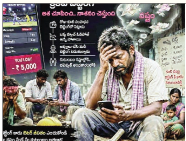
కోరుట్ల, ప్రభాతవార్త :

పర్యవేక్షణ కరువు.. పట్టించుకునేవాళ్లే లేరు రూ. 1000 కి రూ. 2000