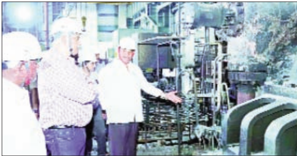
పర్యవేక్షణలో భద్రతా చర్యలు పటిష్ట పరిచి ఇలాంటి ఘటనలు పునరావృతం కాకుండా అప్రమత్తంగా ఉండాలన్నారు. ఈ కార్యక్రమంలో అధికారులు, స్థానిక ప్రజాప్రతినిధులు, ఉద్యోగులు పాల్గొన్నారు