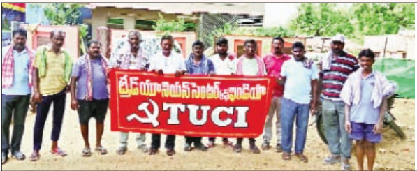
తల్లాడ, మే 18, ప్రభాతవార్త