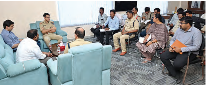
ఈనెల 20వతేదీ సిఎం చంద్రబాబునాయుడు కుప్పం పర్యటనను ఆధికారులు సమన్వయంతో పనిచేసి జయప్రదం చేయాలని ప్రభుత్వవివే, కడ పిఎస్ చైర్మన్ డాక్టర్ కంచర్ల శ్రీకాంత్ పేర్కొన్నారు.