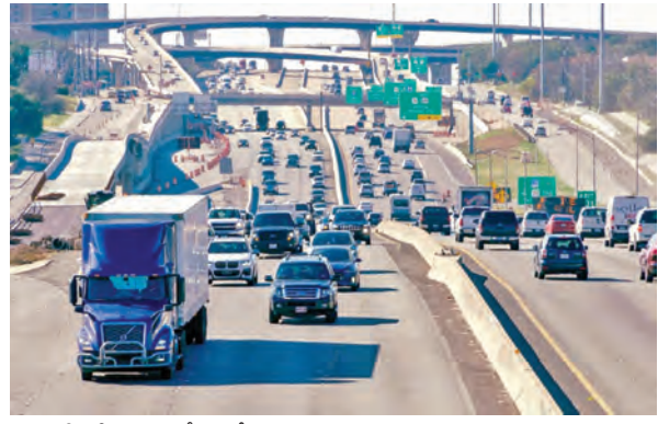
న్యూఢిల్లీ, మే 19: దేశంలో రవాణా వ్యవస్థను ప్రపంచ స్థాయికి చేర్చే లక్ష్యంతో కేంద్ర ప్రభుత్వం జాతీయ రహదారుల ద్వారా నిధులు సమీకరించి, వాటితో కొత్త రోడ్ల నిర్మాణం చేపట్టేందుకు సిద్ధమైంది. ఇందులో భాగంగా వచ్చే ఆర్థిక సంవత్సరంలో 28 ప్రధాన హైవేలను ప్రైవేట్ సంస్థలకు లీజుకు ఇవ్వడం ద్వారా రూ.35వేల