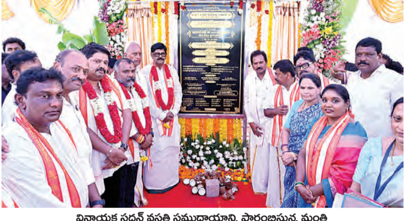
వినాయక సదన వసతి సముదాయాన్ని ప్రారంభిస్తున్న మంత్రి