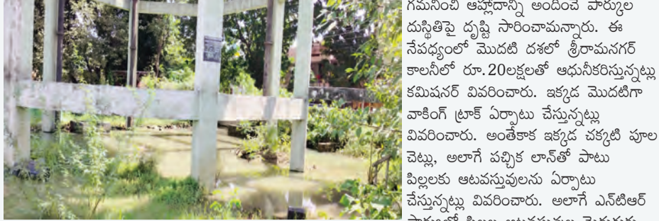
శ్రీరామనగర్ కాలనీలోని పార్కు దృశ్యం