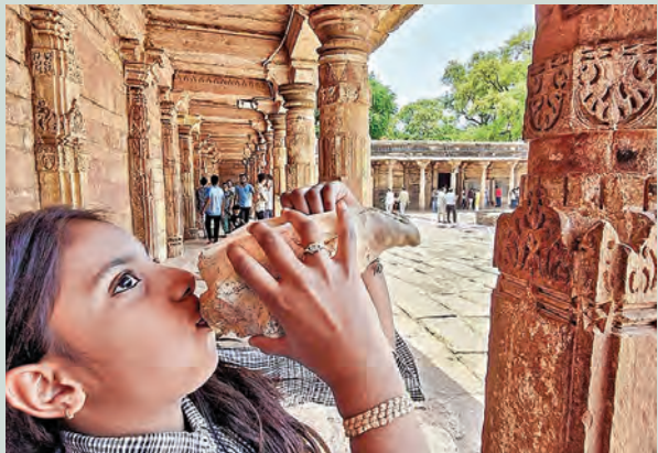
శుక్రవారం ధారోల్‌ని భోజేశాల ఆలయంలో ప్రజలు ప్రార్థనలు చేస్తుండగా ఓ బారిక శంఖం పూరిస్తున్న దృశ్యం