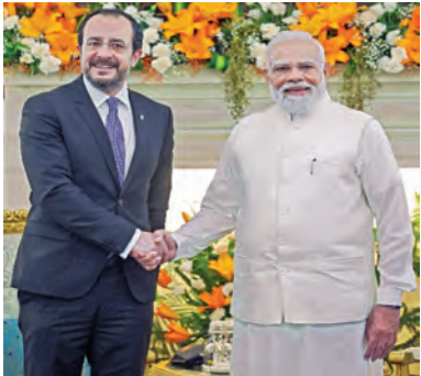
శుక్రవారం న్యూఢిల్లీలో ప్రధాని మోడీతో భేటీ అయిన సైప్రస్ అధ్యక్షుడు నికోస్ క్రిస్టోడోరిడ్స్

సంచలనం సృష్టించిన ఐపిఎల్ ఉప్పల్ మ్యాచ్ 55 పరుగుల తేడాతో బెంగళూరుపై హైదరాబాద్ ఘన విజయం అభిషేక్, ఇషాన్ కిషన్, క్లాసెన్ హాఫ్ సెంచరీలు -'అట'లో