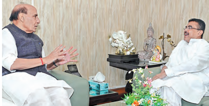
శుక్రవారం న్యూఢిల్లీలో రక్షణ మంత్రి రాజేంద్ర్ సింగ్తో భేటీ అయిన బెంగాల్ సీఎం సువేందు అధికారి

ధాన్యం కొనుగోళ్ల ప్రక్రియను గణాంకాలతో పట్టిక డామినియన్లో పెంచుతున్నప్పుడు వాస్తవాలను కెబీఆర్ వర్ణింపింట్లు చెబుతున్నారని ఆగ్రహం వ్యక్తం చేశారు. ధాన్యం కొనుగోళ్ల, దిగుబడిలో దేశంలోనే తెలంగాణ రాష్ట్రాన్ని నంబర్ వన్గా నిలిపిన ఘనం చేసే మహిళాకే కంగ్రెస్ ప్రభుత్వానిదేనని, అది తట్టుకోలేక కెబీఆర్ నీటిపారుదల ప్రజాసేవకుని దిగుబడిని మంత్రి ఉత్తమ్ దుయ్యబట్టారు. కెబీఆర్, బిఆర్ఎస్ నేతలు చేస్తున్న శవరాజకీయాల ,అసత్య ప్రచారాలు అపరాధం రైతుల సమర్థుని సృష్టించే వేశం.