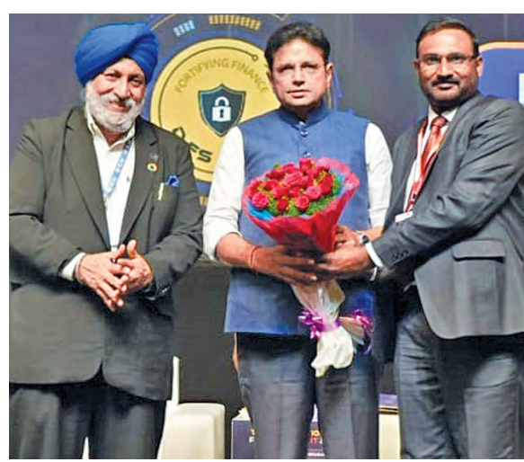
శుక్రవారం హైదరాబాద్ లో డిజిటల్ ట్రాన్స్ ఫర్మేషన్ ఫైనాన్స్ సమ్మిట్ లో పాల్గొన్న మంత్రి శ్రీధర్ బాబు

ప్రభాతవార్త ప్రధాన ప్రతినిధి, హైదరాబాద్, మే 22: డిజిటల్ ట్రాన్స్ ఫర్మేషన్ లో తెలంగాణను దేశంలోని ఇతర రాష్ట్రాలకు రోల్ మోడల్ గా తీర్చిదిద్దేందుకు ప్రణాళికాబద్ధంగా కృషి చేస్తున్నామని రాష్ట్ర ఐటీ, పరిశ్రమల శాఖ మంత్రి దుర్దిక్ష శ్రీధర్ బాబు పేర్కొన్నారు. ఇందులో భాగంగా... ప్రభుత్వ పౌర సేవల్ని మరింత