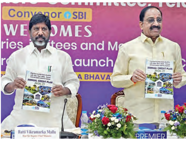
శుక్రవారం హైదరాబాద్ లో జరిగిన బ్యాంకర్ల సమావేశంలో డి.సిఎం భట్టి, మంత్రి తుమ్మల నాగేశ్వరరావు