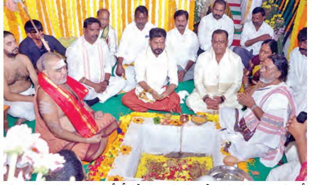
శనివారం యాదగిరిగుట్టలో వేదపాఠశాలకు శంకుస్థాపన దృశ్యం, చిత్రంలో కంచి పీఠాధిపతి విజయలక్ష్మి సరస్వతీస్వామి, సీఎం రేవంత్, మంత్రులు కోమటిరెడ్డి, కొండా సురేష్

వైకుంఠవార్షికం, పాత బస్టాండ్, తులసి కాటేజీ, కొండపైన బెంపులసీటి, కొత్త బస్టాండ్, వాహన పార్కింగ్ ప్రాంతాలు, రింగ్ రోడ్డు తదితర ప్రాంతాలను తమ నియంత్రణలోకి తీసుకున్నారు. ఉదయం 7 గంటల సుందర యాదగిరి గుట్టలో పూజార్థం ప్రకటించి ప్రతి వాహనం, ప్రతివ్యక్తిని క్లుప్తంగా తనిఖీ చేశారు. సీఎం హెలి కాప్టర్ కొండపై హెలిపాడ్ వద్ద దిగుతారని భావించిన అధికారులు, భద్రతా సిబ్బంది ముందస్తు ఏర్పాట్లు చేశారు. అయితే సీఎం రేవంత్ రెడ్డి నేరుగా బెంపులసీటికి చేరుకోవడంతో అధికారులు ఒక్కసారిగా ఆ ప్రయత్నం వ్యర్థం. కొండపై ఉన్న అధికారులు చూడటానికి బెంపుల సీటికి చేరుకుని సీఎంకు ఘనస్వాగతం పలికారు. కొద్దిసేపు హెలిపాడ్ వద్దనే నిలిచిన సీఎం ఆనంతరం భూమిపూజ జరిగి