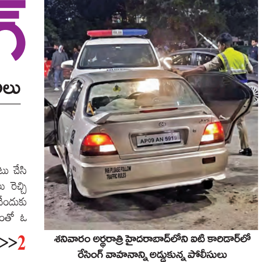
శనివారం అర్ధరాత్రి హైదరాబాద్ లోని బది కాలడార్లో రేసింగ్ వాహనాన్ని అడ్డుకున్న పోలీసులు

హైదరాబాద్ (గట్టెబి.వి.) మే 24 ప్రభాతవార్త: వారాంతం వచ్చిందంటే బది కారడం సువిశాలమైన రోడ్ల పోకీరీలకు అడ్డాగా మారుతున్నాయి. అర్ధరాత్రి మితిమీరిన వేగంతో కారు, బైక్ రేసింగులు నిర్వహిస్తూ పోకీరీలు స్థానికంగా భయానక వాతావరణం సృష్టిస్తున్నారు. రేసింగుల కారణంగా ప్రమాదాలు చోటుచేసుకుంటుం >>2