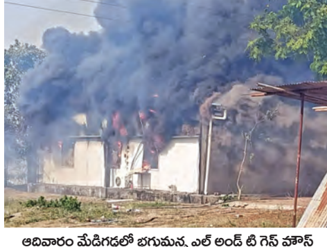
అదివారం మేడిగడ్డలో భగ్నమైన ఎల్ అండ్ టి గెస్ వాస్

మహాదేవపూర్, మే 24, ప్రభాతవార్త: జయశంకర్ భూపాలపల్లి జిల్లా మహాదేవపూర్ మండల పరిధిలోని అబట్ వల్లి (మేడిగడ్డ) గ్రామ సమీపంలో గల ప్రసిద్ధ ఎల్ అండ్ టి గెస్ వాస్ ఆదివారం మధ్యాహ్నం భారీ అగ్నిప్రమాదం సంభవించింది. మధ్యాహ్నం సుమారు 3:00 గంటల ప్రాంతంలో ఒక్కసారిగా వెలరెగిన మంటలు గెస్ వాస్ నలుమూలలా వ్యాపించడంతో స్థానికంగా తీవ్ర కలకలం రేగింది. కాగా సమీప పొలాల్లో రైతులు వ్యవసాయ వ్యర్థాలను తగులబెట్టడమే ఈ ప్రమాదానికి ప్రధాన కారణమని ప్రాథమిక సమాచారం ద్వారా తెలుస్తోంది. స్థానికులు మరియు ప్రత్యక్ష సాక్షుల కథనం ప్రకారం.. అబట్ వల్లి గ్రామ శివార్లలోని పరి పొలాల్లో పంట కోతల అనంతరం మిగిలిన దుబ్బలు, గడ్డి వంటి వ్యవసాయ వ్యర్థాలను కొందరు రైతులు తగులబెట్టారు. అయితే ఎండ తీవ్రత ఎక్కువగా >>2