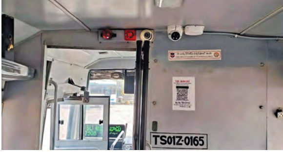
బస్సులో సిసి కెమెరాల అమర్చిన దృశ్యం

ప్రయాణికుల భద్రత కోసం వినూత్న పథకానికి ఆర్టీసీ శ్రీకారం బస్సుల్లో అత్యాధునిక సిసి కెమెరాలు కంట్రోల్ రూమ్ నుంచి నిరంతర పర్యవేక్షణ ఆదిలాబాద్ లో ఫైలర్ ప్రాజెక్టు ప్రారంభం