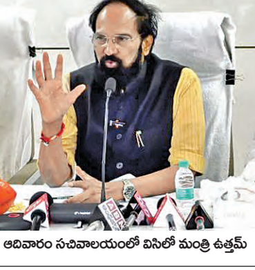
అధికారం సచివాలయంలో వినిలో మంత్రి ఉత్తమ్

హైదరాబాద్, మే 24, ప్రభాతవార్త: యాసంగి ధాన్యం కొనుగోళ్లకు మరల వేగంగా కొనుగోళ్లకు మంత్రి ఉత్తమ్ కుమార్ రెడ్డి ప్రత్యేక చర్యలు చేపట్టారు. ప్రధానంగా కొనుగోళ్ల నెమ్మదింపేందుకు కారణమైన లారీల కొరతపై ప్రత్యేక దృష్టి సారించారు. ఈ సమస్య అధిగమించేందుకు పక్కపొండ్ల యాక్స్ ప్లాన్ సిద్ధం చేశారు. ఇందులో భాగంగా లారీల కొరత ఉన్న ప్రాంతాల్లో ధాన్యం తరలింపును ఇసుక, సిమెంట్ లారీలను వాడుకోవాలని సూచించారు. ఈ మేరకు రాజాశాఖ అధికారులకు, జిల్లా కలెక్టర్లకు ప్రభుత్వం ఆదేశాలు జారీ చేసింది. రైతు >>2