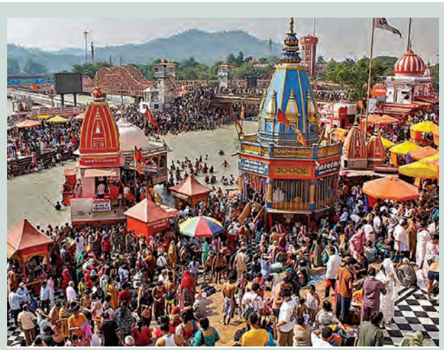
ఆదివారం హైదరాబాద్లో 'గంగా దసరా' చందుగుకు ముందు గంగానదిలో పుణ్యస్నానమాచరిస్తున్న భక్తులు