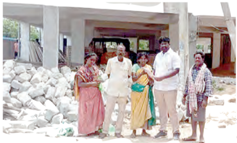
తిరుపతి, మే 24 ప్రభాతవార్త: