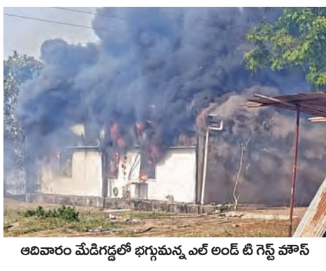
అదివారం మేడిగడ్డలో భగ్నమైన ఎల్ & టి గెస్ట్ హౌస్

మహబూబ్ నగర్, మే 24, ప్రభాతవార్త: జయశంకర్ భూపాలపల్లి జిల్లా మహబూబ్ నగర్ మండల పరిధిలోని అంబల్ పల్లి (మేడిగడ్డ) గ్రామ సమీపంలో గల ప్రసిద్ధ ఎల్ & టి గెస్ట్ హౌస్ లో ఆదివారం మధ్యాహ్నం భారీ అగ్నిప్రమాదం సంభవించింది. మధ్యాహ్నం సుమారు 3:00 గంటల ప్రాంతంలో ఒక్కసారిగా వెలరేగిన మంటలు గెస్ట్ హౌస్ నలుమూలలా వ్యాపించడంతో స్థానికంగా తీవ్ర కలకలం రేగింది. కాగా సమీప పొలాల్లో రైతులు వ్యవసాయ వ్యర్థాలను తగులబెట్టడమే ఈ ప్రమాదానికి ప్రధాన కారణమని ప్రాథమిక సమాచారం ద్వారా తెలుస్తోంది. స్థానికులు మరియు ప్రత్యేక సాక్షుల కడనం ప్రకారం.. అంబల్ పల్లి గ్రామ శివార్లలోని వరి పొలాల్లో పంట కోతల అనంతరం మిగిలిన దుబ్బలు, గడ్డి వంటి వ్యవసాయ వ్యర్థాలను కొందరు రైతులు తగులబెట్టారు. అయితే ఎండ తీవ్రత వ్యర్థాల >>2