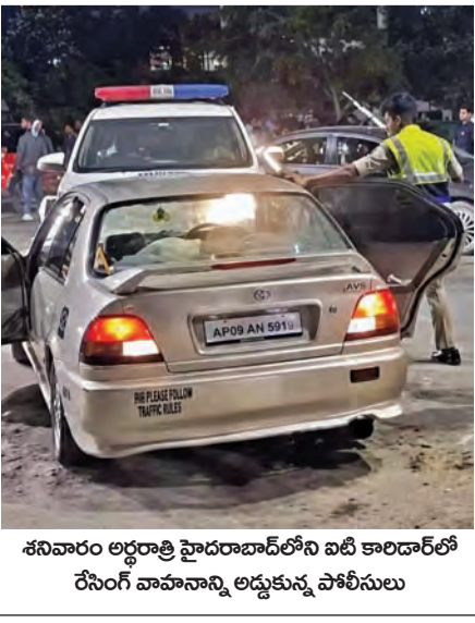
పోలీసులకు గాయాలయ్యాయి. రేసింగ్ వాహనాన్ని అడ్డుకున్న పోలీసులు

హైదరాబాద్ రోడ్లపై భయానక వాతావరణం సృష్టిస్తున్న పోకీరిలు అర్ధరాత్రి కార్ల విన్యాసాలతో కంగారుపడుతున్న జనం కారు డ్రీకొని ఓ పోలీసుకు గాయాలు.. యువకుడి అరెస్టు హైదరాబాద్ (గచ్చిబౌలి), మే 24 ప్రభాతవార్త: వారాంతం వచ్చిందంటే ఐటీ కారిడార్ నుంచి వచ్చిన రోడ్డు పోకీరిలకు అడ్డంగా మారుతున్నాయి. అర్ధరాత్రి మితిమీరిన వేగంతో కారు, జైక్ రేసింగ్ లు నిర్వహిస్తున్న పోకీరిలు స్థానికంగా భయానక వాతావరణం సృష్టిస్తున్నారు. రేసింగ్ లు కారణంగా ప్రమాదాలు చోటుచేసుకుంటుండడంతో గతంలో పోలీసులు వచ్చి నిఘా ఏర్పాటు చేసి అడ్డుకున్నారు. కాగా తాజాగా మరోసారి పోకీరిలు రెచ్చిపోయి రేసింగ్ లు పాల్గొంటుండగా, అడ్డుకునేందుకు యత్నించిన పోలీసుల మీద కారు దూకించడంతో ఓ కానిస్టేబుల్ కు పోలీసు గాయాలయ్యాయి. రేసింగ్ కారును అడ్డుకొని స్వాధీనం చేసుకున్న రాయ >>2