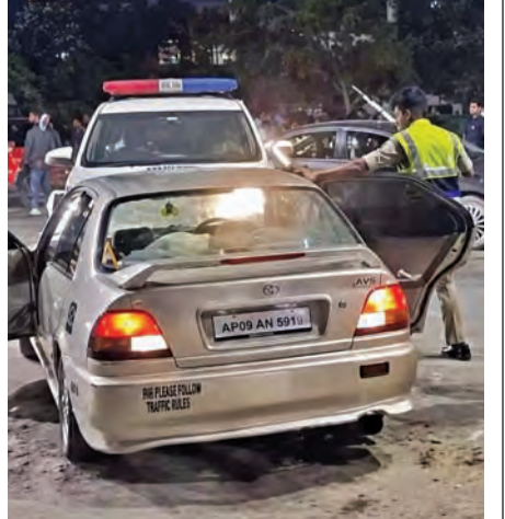
శనివారం అర్ధరాత్రి హైదరాబాద్ లోని బి కారిడార్ లో రేసింగ్ వాహనాన్ని అడ్డుకున్న పోలీసులు

డడంతో గతంలో పోలీసులు పట్టి నిఘా ఏర్పాటు చేసి అడ్డుకున్నారు. కాగా తాజాగా మరోసారి పోకిరీలు రెచ్చి పోయి రేసింగ్ లకు పాల్పడుతుండగా, అడ్డుకునేందుకు యత్నించిన పోలీసుల మీద కారు దూకినవడంతో ఓ కారు స్ట్రెయిట్ కు స్వల్ప గాయాలయ్యాయి. రేసింగ్ కారును అడ్డుకొని స్వాధీనం చేసుకున్న రాం >>2