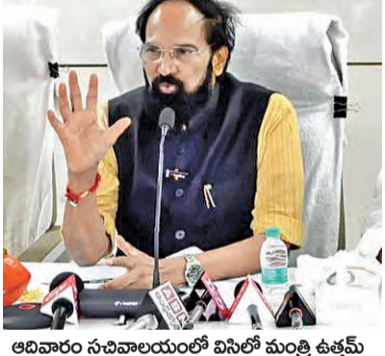
ఆదివారం సచివాలయంలో విసిలో మంత్రి ఉత్తమ

లకు ఇబ్బంది కలుగకుండా మిల్లలకు ధాన్యాన్ని సకాలంలో చేర్చడమే రాష్ట్ర ప్రభుత్వ లక్ష్యమని స్పష్టం చేశారు. ఈ విషయమై ఆదివారం సచివాలయం నుంచి వివిధ జిల్లాల కలెక్టర్లతో ధాన్యం కొనుగోళ్లపై వీడియో కాన్ఫరెన్స్ నిర్వహించారు. కొనుగోళ్లు కేంద్రాల్లో తరుగు, తేమ పేరుతో రైతులను మోసం చేస్తే ఎవరినైనా క్షమించేది లేదని, కఠిన చర్యలు తీసుకుంటామని హెచ్చరించారు. కింగ్ డొమినో ప్రభుత్వం నిర్వహించిన ధరకంటే తక్కువకు కొనుగోళ్లు చేస్తే ఆయా రైస్ మిల్లలను ఖాళీ లిస్టులో పెడతామని స్పష్టం చేశారు. ఆగ్రహాలకు పాల్పడే దశారులు, మిల్లల్లు >>2