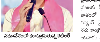
సమావేశంలో మాట్లాడుతున్న కెటిఆర్

'సర్'పై అనుక్షణం అప్రమత్తం కావాలి ఉచిత విద్యుత్ రద్దుకే రైతుల మోటార్లకు మీటర్లు: కెటిఆర్