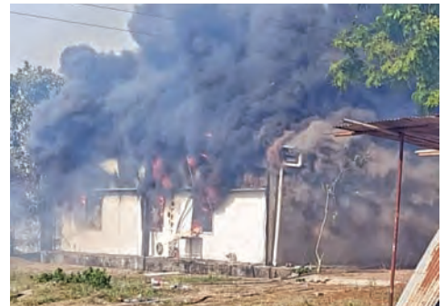
ఆదివారం మేడిగడ్డలో భగ్గుతున్న ఎల్ & టి గెస్ట్ హౌస్

మేడిగడ్డలో భారీ అగ్ని ప్రమాదం • సకాలంలో చర్యలతో తప్పిన ప్రాణనష్టం మహాదేవపూర్, మే 24, ప్రభాతవార్త: జయశంకర్ భూపాలపల్లి జిల్లా మహాదేవపూర్ మండల పరిధిలోని అంబల్ పల్లి (మేడిగడ్డ) గ్రామ సమీపంలో గల ప్రసిద్ధ ఎల్ & టి గెస్ట్ హౌస్ లో ఆదివారం మధ్యాహ్నం భారీ అగ్ని ప్రమాదం సంభవించింది. మధ్యాహ్నం సుమారు 3:00 గంటల ప్రాంతంలో ఒక్కసారిగా చెలరేగిన మంటలు గెస్ట్ హౌస్ నలుమూలలా వ్యాపించడంతో స్థానికంగా తీవ్ర కలకలం రేగింది. కాగా సమీప పొలాల్లో రైతులు వ్యవసాయ వ్యర్థాలను తగలబెట్టడమే ఈ ప్రమాదానికి ప్రధాన కారణమని ప్రాథమిక సమాచారం ద్వారా తెలుస్తోంది. స్థానికులు మరియు ప్రత్యేక స్థానం కలిగిన ప్రకారం.. అంబల్ పల్లి గ్రామ శివార్లలోని పరి పొలాల్లో వంటల అనంతరం విగిలిన దుబ్బాలు, గడ్డి వంటి వ్యవసాయ వ్యర్థాలను కొండరైతులు తగలబెట్టారు. అయితే ఎండ తీవ్రత ఎక్కువగా >>2