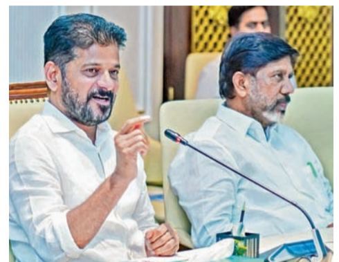
సోమవారం సచివాలయంలో ఇందిరా స్త్రీశక్తి భవనాలకు వర్చువల్ గా శంకుస్థాపన చేస్తున్న సిఎం రేవంత్. చిత్రంలో డి.సిఎం భట్టి

ఒకే రోజు 8 వేల ఇందిరా స్త్రీశక్తి భవనాల నిర్మాణానికి శంకుస్థాపన త్వరలో మహిళలకు కార్పొరేట్ సూపర్ బజార్లు, లాజిస్టిక్ హబ్లు, రైస్ మిల్లులు సచివాలయం నుంచి వర్చువల్ గా శంకుస్థాపన చేసిన సిఎం రేవంత్ మహిళలకు ఇందిరమ్మ చీరెల అందజేశ