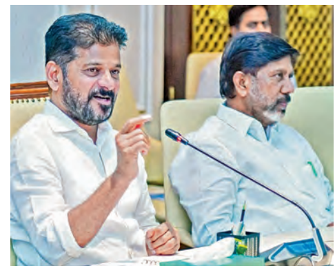
సోమవారం సచివాలయంలో ఇందిరా ప్రీతి భవనాలకు శంకుస్థాపన చేస్తున్న సిఎం రేవంత్, చిత్రంలో డి.సిఎం భట్టి ప్రభాకర్ వారాన ప్రతినిధి, హైదరాబాద్, మే 25: 2034 నాటికి కోటి మంది మహిళలకు కోటి శ్రులంగా చేస్తామని ముఖ్యమంత్రి ఎ.రేవంత్ రెడ్డి సుస్పం చేశారు. మహిళా శక్తిని దేశానికి ఆదర్శంగా నిలబెట్టడమే ప్రజా ప్రభుత్వ సంకల్పమని అన్నారు. 'మహిళలు ఆర్థికంగా నిలబడితే కుటుంబం నిలబడుతుంది, కుటుంబం నిలబడితే గ్రామం బలపడుతుంది, గ్రామం

ఒకే రోజు 8 వేల ఇందిరా ప్రీతి భవనాల నిర్మాణానికి శంకుస్థాపన త్వరలో మహిళలకు కార్పొరేట్ సూపర్ బజార్లు, లాజిస్టిక్ హబ్లు, రైస్ మిల్లులు సచివాలయం నుంచి వర్చువల్ గా శంకుస్థాపన చేసిన సిఎం రేవంత్ మహిళలకు ఇందిరమ్మ చీరల అందజేత