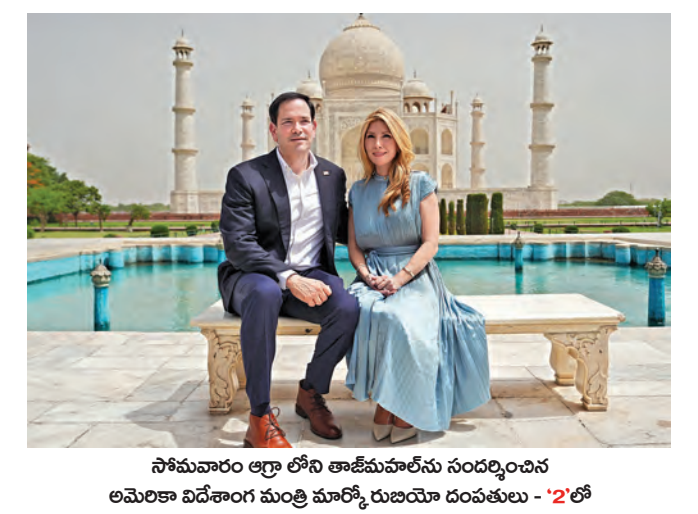
సోమవారం ఆగ్రా లోని తాజ్ మహల్ ను సందర్శించిన అమెరికా విదేశీయ మంత్రి మార్టిన్ రుబయో దంపతులు - '2'లో

ఇరాన్ తో ఒప్పందంపై ట్రంప్ మళ్లీ మెలిక హార్డుట్ దిద్దంధనం కొనసాగింపు! వాషింగ్టన్, మే 25: అమెరికా అధ్యక్షుడు డొనాల్డ్ ట్రంప్ ఇరాన్ తో శాంతి చర్చలపై మరో సారి ఆసక్తికర వ్యాఖ్యలు చేశారు. ఇరాన్ తో ఒప్పందం దాదాపు పూర్తయిందని అదివారం ప్రకటించిన ఆయన, తాజాగా ఆ మాటలకు భిన్నంగా మాట్లాడారు. ఒప్పందం ఇంకా చర్చల దశలోనే ఉందని స్పష్టం చేశారు. ఈ మేరకు తన సోషల్ మీడియా ప్లాట్ఫామ్లు ట్విట్టర్లో ఓ పోస్ట్ చేశారు. చర్చలు సక్రమంగానే సాగుతున్నాయి. కానీ ఒప్పందం విషయంలో తొందరపడబోము. చర్చలకు తగినంత సమయం తీసుకోవాలని మా అధికారులు సూచించారు అని ట్రంప్ పేర్కొన్నారు. ఈ డిల్ ఓ కోర్కొట్ వచ్చేంత వరకు >>2