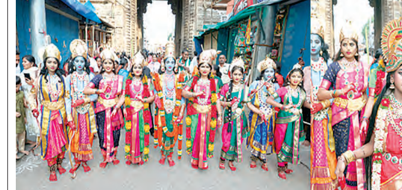
తిరుపతిలోని గోవిందరాజస్వామి దేవాలయంలో నిర్వహించిన సాంఘిక కార్యక్రమంలో పాల్గొన్న వారు.