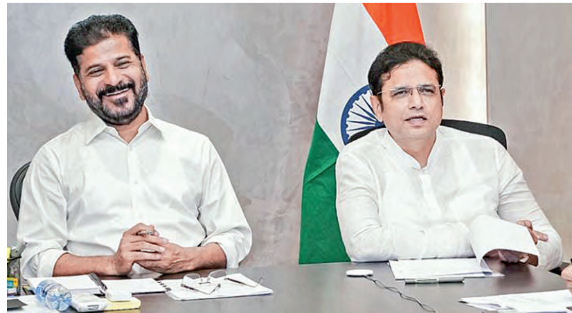
టీపైబి ప్రాజెక్టు అమలుపై బుధవారం కేంద్ర మంత్రి జ్యోతిరాదిత్య సిందియాతో విడియో కాన్ఫరెన్స్ లో మాట్లాడుతున్న సిఎం రేవంత్. చిత్రంలో మంత్రి డి. శ్రీధర్ బాబు

ప్రభాతవార్త ప్రధాన ప్రతినిధి, హైదరాబాద్, మే 27: అమెరికా భారత్ నెట్ ప్రోగ్రామ్ (ఎపిఐ) కింద తెలంగాణలో టిపైబి ప్రాజెక్టు అమలుపై కేంద్ర మంత్రి జ్యోతిరాదిత్య సిందియాతో ముఖ్యమంత్రి పి. రేవంత్ రెడ్డి, పరిశ్రమలు, ఇటీ శాఖ మంత్రి డి. శ్రీధర్ బాబుతో కలిసి వీడియో కాన్ఫరెన్స్ లో పాల్గొన్నారు. అమెరికా భారత్ నెట్ ప్రోగ్రామ్ సహజంగా అమలు చేసే దిశగా ముఖ్యమంత్రి కొన్ని కీలక అంశాలను సిందియా దృష్టికి తీసుకువెళ్లారు. అమలుకు సంబంధించిన ఒప్పందాన్ని త్వరితగతిన కుదుర్చుకోవడం, పెండింగ్ లో ఉన్న నిధుల విడుదలను వేగవంతం చేయడంపై పేర్కొన్నారు. మండలం నుండి గ్రామ పంచాయతీ రింగ్ నెట్ వర్క్ అమలుపై డిజిటల్ భారత్ నిధికి బదిలీ >>2