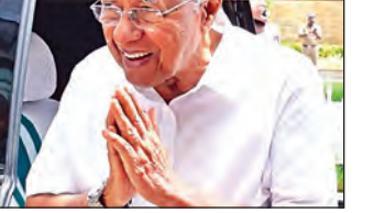
पिनारै विजयन की बेटी टी वी की कंपनी से जुड़े मनी लॉन्ड्रिंग के मामले में ईडी की जांच रद्द कराने की मांग की थी।

लाठी-पत्थर बरसाए, गाड़ी तोड़ी, पूर्व केरलम सीएम की बेटी पर मनी लॉन्ड्रिंग का आरोप, घर पर रेड तिरुवनंतपुरम, 27 मई (एजेंसियां)। केरलम के पूर्व मुख्यमंत्री पिनारै विजयन के समर्थकों ने प्रवर्तन निदेशालय (ईडी) की टीम पर सीपीआई समर्थकों ने हमला कर दिया। ईडी की 12 सदस्यीय टीम सुबह 7 बजे तिरुवनंतपुरम के बेकरी जंक्शन स्थित विजयन के घर समेत 10 ठिकानों पर मनी लॉन्ड्रिंग मामले में रेड करने पहुंची थी।