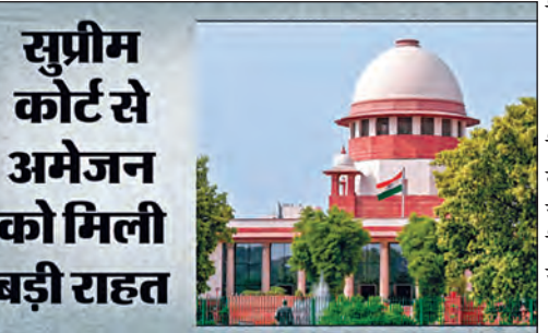
सुप्रीम कोर्ट से अमेजोन को मिली बड़ी राहत

नई दिल्ली, 27 मई (एजेंसियां)। सुप्रीम कोर्ट ने बुधवार को ई-कॉमर्स क्षेत्र की दिग्गज अमेरिकी कंपनी अमेजोन को बड़ी राहत मिली है। सुप्रीम कोर्ट ने नेशनल कंपनी लॉ अपीलेट ट्रिब्यूनल (एनसीएलएटी) के उस आदेश को रद्द कर दिया है, जिसमें फ्यूचर ग्रुप के साथ अमेजोन के निवेश सौदे पर लगे एंटी-ट्रस्ट निलंबन के खिलाफ उसकी अपील खारिज कर दी थी। यह फैसला बुधवार को न्यायमूर्ति विक्रम नाथ और न्यायमूर्ति संदीप मेहता की पीठ ने सुनाया।