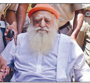
आसाराम बापू को दोषसिद्धि और सजा के खिलाफ उनकी अपील को खारिज कर दिया।

जयपुर, 27 मई (एजेंसियां)। राजस्थान हाई कोर्ट ने बुधवार को नाबालिग से बलात्कार के मामले में आसाराम बापू को दो गई आजीवन कारावास की सजा को बरकरार रखा है। इसी के साथ ही कोर्ट ने 2018 में निचली अदालत द्वारा पारित दोषसिद्धि और सजा के खिलाफ उनकी अपील को खारिज कर दिया। हालांकि, बेंच ने उन्हें सामूहिक बलात्कार और आपराधिक साजिश के आरोपों से बरी करके कुछ राहत जरूर दी है। अदालत ने आसाराम को आत्मसमर्पण करने का निर्देश भी दिया। आसाराम फिलहाल चिकित्सा कारागारों से अंतरिम जमानत पर बाहर हैं।