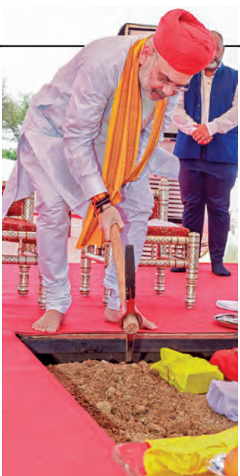
గుజరాత్లోని గాంధీనగర్లో పలు ఆభివృద్ధి పనులకు శంకుస్థాపనలు చేస్తున్న కేంద్రప్రభుత్వం మంత్రి అమిత్ షా

>> 43.3సెంట్రి నమోదైంది. కొమరంబీం జిల్లా సిర్కార్లలో నవ్వెల్లి గ్రామంలో 43.01 సెంట్రి ఊష్ణోగ్రత నమోదైంది. సిద్దిపేట, మెదక్, నాగేకర్నూల్, సంగారెడ్డి, హైదరాబాద్, రంగారెడ్డి, మేడ్చల్ మల్కాజ్గిరి, వికారాబాద్, నారాయణపేట, వనపర్తి, మహబూబ్ నగర్, జోగురాంబ జిల్లాలలో గత నెలలోజూలుగా జారవేసిన అలర్లు స్పీటిని ఉప సంపారించారు. ఆదిరాబాద్ జిల్లానగలు ఊష్ణోగ్రత 41 నమోదైంది, కుమురంబీం, మందిరాల, భద్రాద్రి కొత్తగూడెం, ఖమ్మం, మహబూబాబాద్, జయశంకర్ భూపాలపల్లి, పెద్దపల్లి, ములుగు, వరంగల్ జిల్లాలో 40నుం, గ్రే ఊష్ణోగ్రత నమోదుకావడం తో ఆయా జిల్లాలలో అరెంజ్ అలర్లుగా ప్రకటించారు. సూర్యుపేట, నల్ల గండ, నిర్మల్, నిజామాబాద్ జగిత్యాల, హన్మంతపల్లి, కరీంనగర్, జన గామ, కామారెడ్డి రాజన్న సిరిసిల్ల, యాదాద్రి సిరిసిల్లలో 36సెంట్రి ఊష్ణోగ్రత నమోదు కావడంతో ఎల్లోఅలర్లుగా కొనసాగించారు. గత మూడు రోజులుగా కురిసిన వర్షాలు వెనక్కి తగ్గడంతో వడగాడ్డుల ప్రభావంపెరిగింది. వాయువ్య దిశనుంచి వీస్తున్న వేడిగాడ్డులతో వృద్ధులు, మహిళలు పిల్లలు చాలా ఇబ్బంది పడ్డారు.