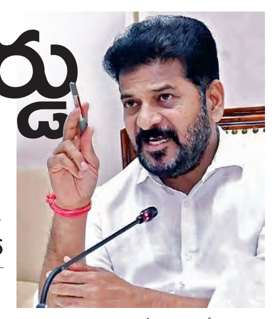
ఇన్నూవేషన్ పథకాలు, ప్రభుత్వం తీసుకువస్తున్న బీమా పథకాల వివరాలు ఉండాలని చెప్పారు. ఆవసరమైతే ఆధార్ నంబర్ తరహాలో రాష్ట్ర స్థాయిలో ప్రత్యేక యూనిక్ ఐడెంటిటీ నంబర్ ఇచ్చేలా ఆలోచించాలన్నారు. ఇటీవల ప్రభుత్వం నిర్వహించిన సమగ్ర సామాజిక, ఆర్థిక, విద్య, ఉపాధి, రాజకీయ, కుల సర్వే వివరాలను కూడా ఈ కార్డుకు అనుసంధానించాలన్నారు. లబ్ధిదారుల వివరాలతో పాటు వివిధ శాఖల్లో పనిచేస్తున్న కాంట్రాక్ట్, అవుట్ సోర్సింగ్ ఉద్యోగుల సంఖ్య, ఇతర వివరాలను సేకరించాలని సీఎం రేవంత్ చెప్పారు. ఏవైనా అధికార పక్షానికి ఉండాలని సీఎం రేవంత్ ఆలోచించారు. ఏవైనా అధికార పక్షానికి ఉండాలని సీఎం రేవంత్ ఆలోచించారు. ఏవైనా అధికార పక్షానికి ఉండాలని సీఎం రేవంత్ ఆలోచించారు. >>2

ఇక సంక్షేమ కార్డు ప్రతి శాఖ వేర్వేరుగా కార్డులు ఇచ్చే పద్ధతికి స్వస్తి అన్ని శాఖల నుంచి లబ్ధిదారుల డేటా సేకరణకు ప్రత్యేక డ్రైవ్ ఐటీ శాఖ ఆధ్వర్యంలో సమగ్ర సంక్షేమ కార్డు రూపకల్పన మంత్రి శ్రీధర్ బాబుతో కలిసి సీఎం రేవంత్ రెడ్డి సమీక్ష