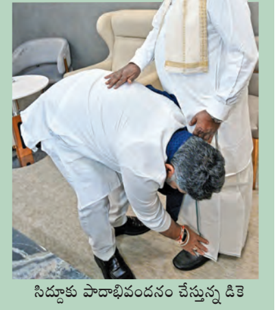
సిద్ధూకు పాదాభిషేకం చేస్తున్న డి.కె.

సిద్ధరామయ్య రాజీనామా బెంగళూరు, మే 28: కర్ణాటకలో సుదీర్ఘకాలంగా కొనసాగుతున్న నాయకత్వ మార్పిడి సమస్యకు హైకమాండ్ ఎట్టకేలకు తెరదించింది. సీఎం పదవిని ఇరువురు నేతలు పంచుకోవాలన్న ఒప్పందంతో భాగంగానే రాష్ట్ర కొత్త సీఎంగా ప్రస్తుత ఉప ముఖ్యమంత్రి డి.కె.శివకుమార్ కు అవకాశం కల్పించాలని హైకమాండ్ ఆదేశించడంతో సిద్ధరామయ్య అంగీకరించారు. వయసు సైబరుకుండా, ప్రభుత్వంపై క్రమేపీ వ్యతిరేకత వస్తోందని, ఈ క్రమంలో నాయకత్వ మార్పు అనివార్యమని ఆయనకు హితోక్తులు చెప్పి తూ హైకమాండ్ రాజ్యసభ ఆఫీసరుడూ ఇచ్చింది. ఢిల్లీ నుంచి >>2