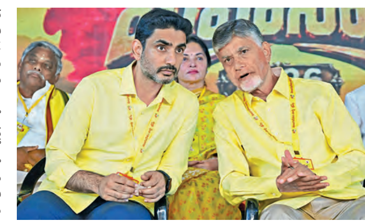
మహానాడు వేదికపై ఎపి ముఖ్యమంత్రి చంద్రబాబు, మంత్రి లోకేష్

భార్యతో ఆని నిర్ణయం తీసుకున్నామన్నారు. ఎవరైనా తన ప్రసంగం ముందు నా తెలుగుదేశం.. నా భార్యతో ఆని చెప్పాల్సిందేనని ఆయన స్పష్టం చేశారు. జెన్-జెడ్ ఏమిటి అంటే... ఆలోచించి అందుకు అనుగుణంగా తాము ముందుకు వెళ్లాల్సి ఉందన్నారు. స్థానిక సంస్థల ఎన్నికలకు తాము సిద్ధంగా ఉన్నామని పేర్కొన్నారు. వైసీపీ అధినేత, మాజీ సీఎం వైఎస్ జగన్మోహన్ తాము ఏకకక్షంగా ఏకగ్రీవాల చేసుకోమని చెప్పారు. తాము ప్రజాస్వామ్య బద్ధంగా వ్యవహరిస్తామన్నారు. జగన్ ప్రభుత్వ హయాంలో స్థానిక ఎన్నికలలో నామినేషన్ పేపర్లు రాకుండా ఎలా వ్యవహరించారోనే అందరం చూశామన్నారు. అందుకనే ఆయన ఏకగ్రీవాల చేస్తే ఉదాహరణగానే చెబుతున్నారని తెలిపారు. నాడు ఆయన చేశాడు కాబట్టి నేడు భయపడుతున్నారంటూ జగన్ వైఖరిని ఈ సందర్భంగా లోకేష్ ఎండగట్టారు. డీఎస్ పరీక్షలు, నియామకాలు పూర్తయిన ఆరు నెలలు తర్వాత అందులో అక్షమాలు జరిగారని జగన్ ఆరోపించడం ఏమిటని లోకేష్ సవాలు చేశారు.