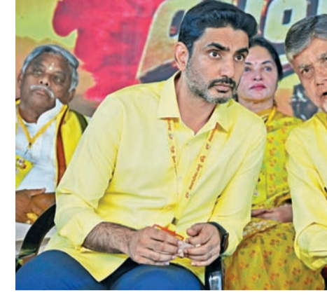
మహానాడు వేదికపై ఎపి ముఖ్యమంత్రి చంద్రబాబు, మంత్రి లోకేశ్

భాద్యత' అని నిర్ణయం తీసుకున్నామన్నారు. ఎవరైనా తన ప్రసంగం ముందు నా తెలుగుదేశం.. నా భాద్యత అని చెప్పాల్సిందేనని ఆయన స్పష్టం చేశారు. జెన్-జెడ్ ఏమిటి అంటే... ఆలోచించి అందుకు అనుగుణంగా తాము ముందుకు వెళ్ళాల్సి ఉందన్నారు. స్థానిక సంస్థల ఎన్నికలకు తాము సిద్ధంగా ఉన్నామని పేర్కొన్నారు. వైసీపీ అధినేత, మాజీ సీఎం వైఎస్ జగన్‌లాగా తాము ఏకపక్షంగా ఏకగ్రీవాలు చేసుకోమని చెప్పారు. తాము ప్రజాస్వామ్య బద్ధంగా వ్యవహరిస్తామన్నారు. జగన్ ప్రభుత్వ హయాంలో స్థానిక ఎన్నికలలో నామినేషన్ పేపర్లు లాక్కుని ఎలా వ్యవహరించారనేది అందరం చూశామన్నారు. అందుకే ఆయన ఏకగ్రీవాలు చేస్తే ఊరుకోమన్నారుని చెబుతున్నారని తెలిపారు. నాడు ఆయన చేశాడు కాబట్టే నేడు భయపడుతున్నారంటూ జగన్ వైఖరిని ఈ సందర్భంగా లోకేశ్ ఎండగట్టారు. డిఎస్సీ పరీక్షలు, నియామకాలు పూర్తయిన ఆరు నెలలు తర్వాత అందులో అక్షమాలు జరిగారని జగన్ ఆరోపించడం ఏమిట లోకేశ్ సందేహం