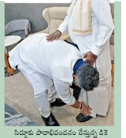
సిద్ధరామయ్య పాదార్పణం చేస్తున్న డి.కె.

సిద్ధరామయ్య రాజీనామా బెంగళూరు, మే 28: కర్ణాటకలో సుదీర్ఘకాలంగా కొనసాగుతున్న నాయకత్వ మార్పిడి సమస్యకు హైకోమాండ్ ఎట్టకేలకు తెరదించింది. సీఎం పదవిని ఇరువురనెవరూ వంచుకోవాలన్న ఒప్పందంతో భాగంగానే రాష్ట్ర కోర్టు సీఎంగా ప్రస్తుత ఉప ముఖ్యమంత్రి డి.కె.శివమూర్తి అవకాశం కల్పించాలని హైకోమాండ్ ఆదేశించడంతో సిద్ధరామయ్య ఆంగీకరించారు. పయను పైబడుతుండటం, ప్రభుత్వంపై క్రమేపీ వ్యతిరేకత వస్తోందని, ఈ క్రమంలో నాయకత్వం మార్పు అనివార్యమని ఆయనకు హితోక్తులు చెప్పతూ హైకోమాండ్ రాజ్యసభ ఆఫీసరూ ఇచ్చింది. ఢిల్లీనుంచి >>2