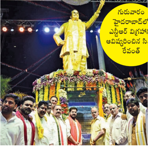
గురువారం హైదరాబాద్ లో ఎన్టీఆర్ విగ్రహాన్ని ఆవిష్కరించిన సీఎం రేవంత్

హైదరాబాద్ (జాబ్బాట్ల), మే 28, ప్రభాతవార్త: ఎన్టీఆర్ కాన్సర్ విగ్రహాన్ని ఆవిష్కరించిన ముఖ్యమంత్రి రేవంత్ రెడ్డి దేశం గర్వించదగిన గొప్ప నాయకుడు మాజీ ముఖ్యమంత్రి నందమూరి తారక రామారావు (ఎన్టీఆర్) అని తెలంగాణ ముఖ్యమంత్రి రేవంత్ రెడ్డి అన్నారు. జాబ్బాట్లలో నియోజకవర్గం లోని అమీర్పేట మైత్రీవనం సర్కిల్లో ఏర్పాటు చేసిన ఎన్టీఆర్ కాంస్య విగ్రహాన్ని ఆవిష్కరించిన అనంతరం నిర్వహించిన సభలో ఆయన మాట్లాడారు. ఎన్టీఆర్, మాజీ ప్రధాని ఇందిరాగాంధీ స్ఫూర్తితోనే తమ ప్రభుత్వం పాలన కొనసాగిస్తోందని సీఎం తెలిపారు. మాకు ఇందిరాగాంధీ ఎంత ముఖ్యమో.. ఎన్టీఆర్ కూడా అంత ముఖ్యుడు అని అన్నారు. దేశ చరిత్రలో స్ఫూర్తిదాయక నాయకులుగా రాజ్యాంగ నిర్మాత బళ్లభ్ టీఆర్ అంబేద్కర్, ఇందిరాగాంధీ, ఎన్టీఆర్లను గుర్తుచేసుకోవాలని రేవంత్ రెడ్డి వ్యాఖ్యానించారు. అంబేద్కర్ మహిళలకు ఓటు హక్కు కల్పించారని, ఇందిరాగాంధీ భారతదేశాన్ని ప్రపంచం ముందు గర్వంగా నిలబెట్టారని కొనియాడారు. ఎన్టీఆర్ తెలుగుజాతిలో అత్యగ్రహణీని