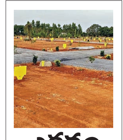
అకరం 237 కోట్ల ధర

ఇరాన్ పై మళ్లీ విరుచుకు పడిన అమెరికా హార్నుక్ తీరప్రాంతంలో నిఘా వ్యవస్థల కూల్చివేత గల్ఫ్ లోని అమెరికా సైనికస్థావరాలపై ఇరాన్ బలజోరీని మెరుపుదాడులు హార్నుక్ ఏ ఒక్కరి సొంతం కాదు.. అంతర్జాతీయ ఆస్తి: ట్రంప్