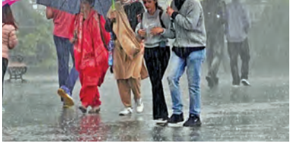
నైరుతి రుతుపవనాలు ఈ యేడాది పదిరోజులు ఆలస్యం కానున్నాయి. నైరుతి రాక ఇంకా ఆలస్యం అవుతుందని తాజాగా ఐఎండీ ప్రకటించింది. జూన్ 4, 5 తేదీల్లో నైరుతి రుతుపవనాలు కేరళ తీరాన్ని తాకే అవకాశం ఉందని, జూన్ రెండో వారంలో అంటే జూన్ 10 నాటికి తెలంగాణను తాకనున్నాయి. ఈ నేపథ్యంలో రుతుపవనాల రాక గతంలో కంటే పదిరోజులు ఆలస్యమయ్యే అవకాశం ఉంది. గతేడాది మే 31 నుండి జూన్ 1 మధ్య

జూన్ 4, 5 తేదీల్లో కేరళ తీరానికి తర్వాత వారానికి తెలంగాణలోకి హైదరాబాద్, మే 29, ప్రభాతవార్త: నైరుతి రుతుపవనాలు ఈ యేడాది పదిరోజులు ఆలస్యం కానున్నాయి. నైరుతి రాక ఇంకా ఆలస్యం అవుతుందని తాజాగా ఐఎండీ ప్రకటించింది. జూన్ 4, 5 తేదీల్లో నైరుతి రుతుపవనాలు కేరళ తీరాన్ని తాకే అవకాశం ఉందని, జూన్ రెండో వారంలో అంటే జూన్ 10 నాటికి తెలంగాణను తాకనున్నాయి. ఈ నేపథ్యంలో రుతుపవనాల రాక గతంలో కంటే పదిరోజులు ఆలస్యమయ్యే అవకాశం ఉంది. గతేడాది మే 31 నుండి జూన్ 1 మధ్య