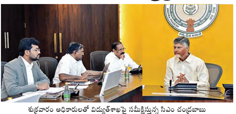
శుక్రవారం అధికారులతో విద్యుత్ శాఖపై సమీక్షిస్తున్న సిఎం చంద్రబాబు

18 గిగావాట్ల విద్యుత్ ప్రధాన గ్రీడ్ కు అనుసంధానం ప్రభుత్వ భవనాలపై సోలార్ పరికరాలు 'పిఎం సూర్యఘోష' పెద్దఎత్తున అమలు విద్యుత్ శాఖపై సమీక్షలో సిఎం చంద్రబాబు