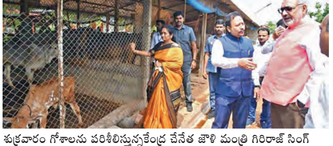
శుక్రవారం గోశాలను పరిశీలిస్తున్న కేంద్ర జాళి మంత్రి గిరిరాజ్ సింగ్

రాష్ట్రంలో పత్తి ఉత్పత్తి పెంచేందుకు చర్యలు మొత్తం రూ.11వేల కోట్ల ప్రాంతావకాల్లో ఎపికి అధిక భాగస్వామ్యం ఎగుమతులు, మౌలిక వసతుల్లో పురోగతి: కేంద్ర జాళి మంత్రి గిరిరాజ్ సింగ్