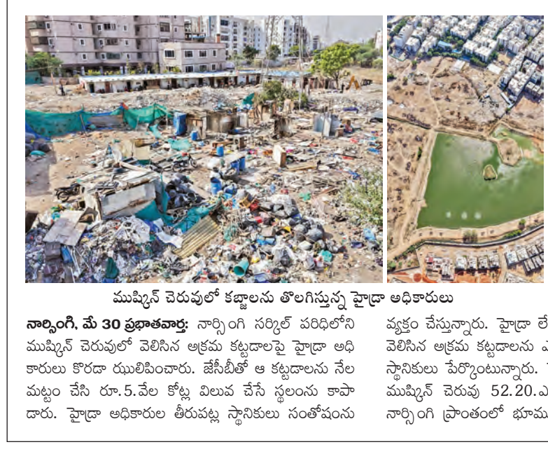
ముప్పిన్ చెరువులో కట్టాలను తొలగిస్తున్న హైదరాబాద్ అధికారులు

మండుటిండల కారణంగా రాష్ట్ర ఆవిర్భావ దినోత్సవాల సమయం మార్పు