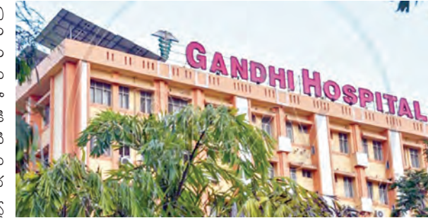
గాంధీ ఆస్పత్రి భవనం

హైదరాబాద్ (సికింద్రాబాద్), మే 30, ప్రభాతపాఠ్యం: కోస్ట్ రోజులుగా విస్తరించిన ప్రజలను భయపెడు తున్న ఎబోలా వైరస్ ను ముప్పును తప్పించుకునేందుకు రాష్ట్ర వైద్య ఆరోగ్యశాఖ అన్ని ఏర్పాట్లు సిద్ధం చేసింది. ఏర్పాట్లలో తలపడుతూ ఉంది. వైరస్ వల్ల ప్రజలకు ఎలాంటి ముప్పు వాటిల్లకుండా అన్ని ఏర్పాట్లు జరుపుతోంది. రాష్ట్రంలో పెద్దపల్లెలను సీకిందరాబాద్ గాంధీ ఆస్పత్రిని రాష్ట్ర నోడల్ కేంద్రంగా సిద్ధం చేసింది. గాంధీ ఆస్పత్రి 7వ అంతస్తులో ఎసిడి ప్రత్యేక గదులతో 25 బెడ్లతో కూడిన 10 ఐసోలేషన్, 15 లాక్డౌండ్లైన వార్డులు ఏర్పాటు చేశారు. ఎబోలా వైరస్ సోకినవారికి వైద్య సేవలందించే నిబ్బంది కోసం కీటీఈ కిట్లను రెడీ చేశారు. ఇప్పటి వరకూ దేశంలో ఎక్కడా కూడా ఒక్కో కేసు కూడా నమోదు కాలేదు. కానీ సోకిన అవకాశాలను కాదనలేమని వైద్యులు చెబుతున్నారు. వైరస్ దేశంలోకి రాకుండానే నివారించడానికి అనేక రకాలుగా ప్రయత్నాలు చేస్తున్నారు. మధ్య ఆఫ్రికా దేశాల నుంచి వచ్చే ప్రయాణికులకు శం పాజాడ్ మినూనా శ్రయంలో స్క్రీనింగ్ టెస్టులు నిర్వహిస్తున్నట్లు సమాచారం. ఈ వైరస్ వ్యాప్తికి ప్రధాన కారణమైన వాటి సేవలలో వైద్యులు ఇప్పటికే అమరాలను కార్యక్రమాలను నిర్వహిస్తున్నారు. అలాగే వైరస్ సోకినప్పుడు తీసుకోవాల్సిన జాగ్రత్తలను కూడా అమరాలను కల్పిస్తున్నారు. తీవ్రమైన జ్వరం, డయెరియా, గొంతునొప్పి, అంతర్గత రక్తస్రావం వంటి లక్షణాలు కలిగి ఉంటాయి అని వివరిస్తున్నారు. ఇలాంటి లక్షణాలు కనిపిస్తే వారికి ఆర్బీసీఆర్, ఎలిజా పరీక్షలు చేసి, నమూనాలను నిర్మాణ కోసం పుణెలోని ఎన్ఎస్ ల్యాబ్ కు పంపిస్తున్నారు. ఎబోలా వైరస్ సోకిన వారు కూడా 21 రోజులపాటు హోం ఐసోలేషన్లో ఉండాలని వైద్య సిబ్బంది సూచిస్తున్నారు. ఎలాంటి విపత్తుల పరిస్థితులు ఎదురైనా ఎదుర్కోవేందుకు