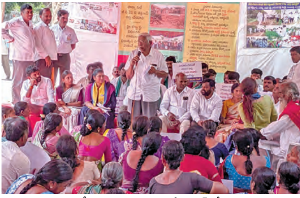
ధర్నానుద్దేశించి ప్రసంగిస్తున్న ప్రొఫెసర్ కోదండరాం