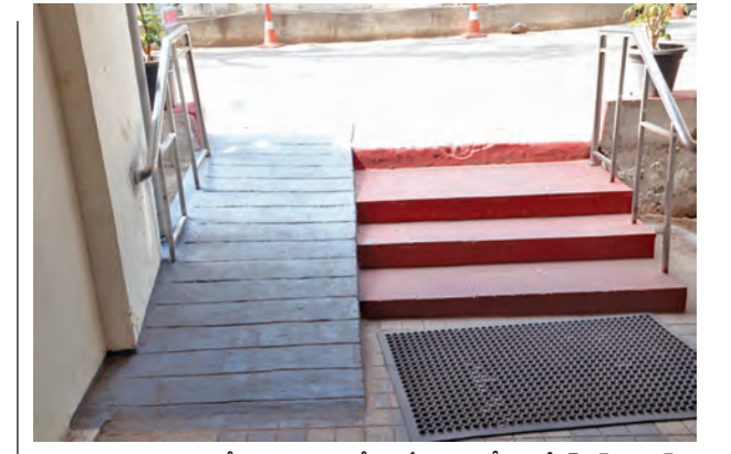
డిజిపి కార్యాలయంలో దివ్యాంగుల కోసం ఏర్పాటు చేసిన వీల్-చైర్ ర్యాంప్.