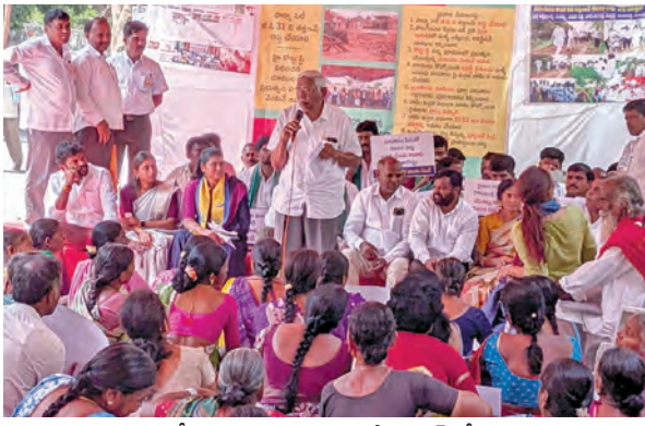
ధర్మానుష్ఠిణి వీధి ప్రసంగిస్తున్న ప్రాధాన్య కోడండారం