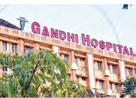
గాంధీ ఆస్పత్రి భవనం

దేశాల నుంచి వచ్చే ప్రయాణికులకు శం పాజాడ్ మినానా శ్రయంలో స్క్రీనింగ్ టెస్టులు నిర్వహిస్తున్నట్లు సమాచారం. ఈ వైరస్ వ్యాప్తికి ప్రధాన కారణమైన వాటి విషయంలో వైద్యులు ఇప్పటికే అచూకాన కార్యక్రమాలు నిర్వహిస్తున్నారు. అలాగే వైరస్ సోకినప్పుడు తీసుకోవాల్సిన జాగ్రత్తలను కూడా అచూకాన కల్పిస్తున్నారు. తీవ్రమైన జ్వరం, డయెరియా, గంతుసాన్ని, అంతర్గత రక్తస్రావం వంటి లక్షణాలు కలిగి ఉంటాయి అని వివరిస్తున్నారు. ఇలాంటి లక్షణాలు కనిపిస్తే వారికి ఆఫ్ఐసీఆర్, ఎలిజా పరీక్షలు చేసి, నమూనాలను నిర్మాణ కోసం పుణెలోని ఎన్ఎస్ ల్యాబ్ కు పంపిస్తున్నారు. ఎబోలా వైరస్ సోకిన వారు కూడా 21 రోజులపాటు హోం ఐసోలేషన్ లో ఉండాలని వైద్య నిపుణులు సూచిస్తున్నారు. ఎలాంటి విపత్తుల పరిస్థితులు ఎదురైనా ఎదుర్కోవేందుకు