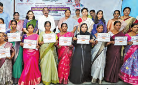
అంశాలపై ప్రత్యేక కార్యక్రమాలు నిర్వహిస్తున్నారని చెప్పారు. మొత్తం ఫోషక భానినలు కాకుండా వాటిని విద్య, వ్యక్తిత్వ వికాసం, నైపుణ్యాల అభివృద్ధికి వినియోగించుకోవాలని సూచించారు.

హైదరాబాద్, మే 30. ప్రభాతవార్త: చదువే ప్రపంచాన్ని మార్చే శక్తివంతమైన ఆయుధమని మహిళా, శిశు సంక్షేమ మంత్రి సీతక్క అన్నారు. జిల్లా కలెక్టర్లతో శనివారం మహిళా వాలోళ్ళు వాల సందర్భంగా నిర్వహించిన స్నేహ సంఘాల మాకే పాఠ్యమైంది అమ్మకు ఆశ్రయాల, అంగన్వాడీ యూనిఫార్ముల పంపిణీ కార్యక్రమాల్లో పాల్గొనిన మాట్లాడుతూ ప్రపంచాన్ని, జీవితాన్ని మార్చే శక్తి చదువుతోనే సాధ్యమవుతుందన్నారు. ఒకచేత జీవితంలో అన్నీ కోల్పోయినా చదువు ఉంటే మళ్ళీ నిలబడగలుగుతామని చెప్పారు. బాలికల కార్యక్రమాల, మేయర్లు, ఎమ్మెల్యేలు, ఎంపీలు కావాలనే లక్ష్య గురించి ముందుకు సాగాలని పిలుపునిచ్చారు. స్నేహ సంఘాల ద్వారా రాష్ట్రవ్యాప్తంగా లక్ష మంది టీఎన్టీ గతంలో లేని యూనిఫార్ములు, 57 కాలా బాలికలను పది వేలకు పైగా స్నేహ గ్రూపులుగా ఏర్పాటుచేసి భద్రత, ఆరోగ్యం, పోషకాహారం, విద్య, సాధికారత