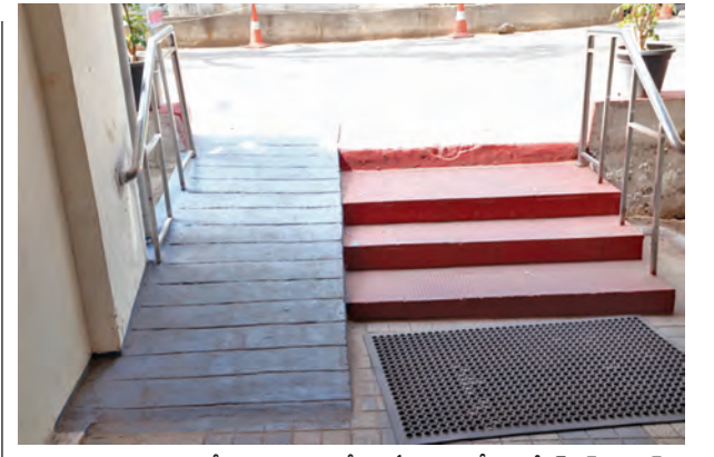
డిజిపి కార్యాలయంలో దివ్యాంగుల కోసం ఏర్పాటు చేసిన వీల్ ఛైర్ ర్యాంప్.