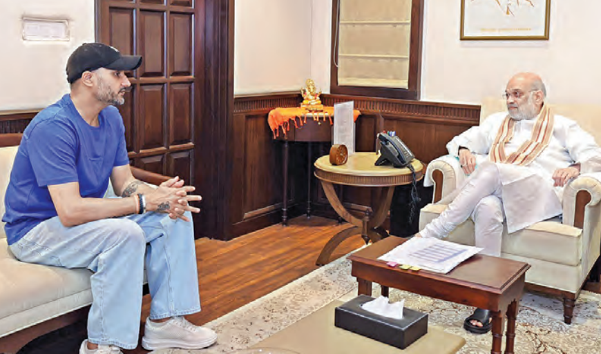
శనివారం న్యూఢిల్లీలో కేంద్ర హోంలెట్ అమిత్ షాతో భేటీ అయిన మాజీ శ్రీకెటెట్ హార్వజన్ సింగ్