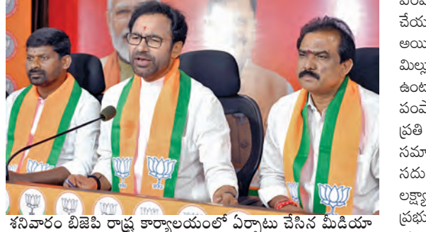
శనివారం బీజెపి రాష్ట్ర కార్యాలయంలో ఏర్పాటు చేసిన మీడియా సమావేశంలో మాట్లాడుతున్న కేంద్రమంత్రి కిషన్ రెడ్డి

వారి సమస్యలను పరిష్కరించడంలో సర్కారు పూర్తిగా విఫలం: కేంద్రమంత్రి కిషన్ రెడ్డి