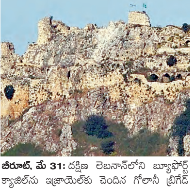
తురు, మే 31: దక్షిణ లెబనాన్ లోని బ్యూఫోర్డ్ క్యాజిల్ ను ఇజ్రాయెల్ కు చెందిన గోలాని ట్రిగ్

దళాలు స్వాధీనం చేసుకొన్నాయి. అనంతరం బ్యూఫోర్డ్ క్యాజిల్ ను ఇజ్రాయెల్ పతాకాలను ఎగిరవేశాయి. 1982లో లెబనాన్ తో తొలి యుద్ధంలో ఇజ్రాయెల్ దళాలు ఈ కోటను మొదట *సారి స్వాధీనం చేసుకొన్నాయి. అప్పుడు కూడా గోలాని ట్రిగ్ దళాల పాలనా లిబరేషన్ అర్మిజేషన్ దళాలతో పోరాడి కోటను ఆక్రమించాయి. నాటి నుంచి 2000 సంవత్సరం వరకు ఈ కోట ఇజ్రాయెల్ ఆధీనంలోనే ఉంది. ఆ తర్వాత లెబనాన్ ఆధీనంలోకి వచ్చింది. తాజాగా ఇజ్రాయెల్ పునాది దళాలు భారీగా దాడులు చేసిన మార్షాడ్ తిరిగి ఈ కోటను వడిఎఫ్ స్వాధీనం చేసుకుంది. దక్షిణ లెబనాన్, ఉత్తర