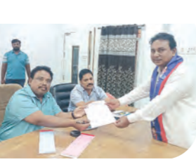
చీరాలలో ఉన్న డ్రైనేజీ సమస్యలను పరిష్కరించాలి