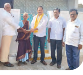
పేదల ఇళ్లలో పింఛన్ల సందర్శన

మహబూబ్ నగర్, జూన్ 1, ప్రభాతవార్త ఎస్సీలో ఒకటి తేదీన మండలంలో ఎన్నికల భరోసా పింఛన్ పంపిణీ కార్యక్రమం వందలకొద్దం సాగింది. ఎఫ్కే నగదును అందుకున్న వృద్ధులు, దీవాళ్ళందరూ, ఇతర అభిదారులు సంతోషంతో పొంగిపోయారు. కూటమి ప్రభుత్వం మంచి ప్రభుత్వం అంటూ ఆశీర్వాదాలు అందించారు.