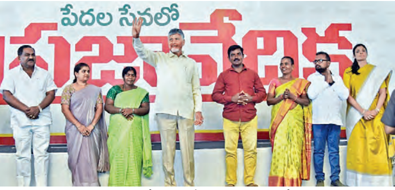
సోమవారం వామవరం గ్రామ ప్రజావేదిక సభలో ప్రజలకు అభివాదం చేస్తున్న సిఎం చంద్రబాబు

2-6-2026 మంగళవారం సంపుటి: 32 సంచిక: 122 పేజీలు: 12 వెల: 6.50