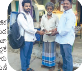
పేదల కళ్ళల్లో ఆనందం చూడాలన్నదే కూటమి ప్రభుత్వం ఆశయం

లింగసముద్రం, జూన్ 1, ప్రభాతవార్త రాష్ట్ర ప్రభుత్వం ప్రతిష్టాత్మకంగా నిర్వహిస్తున్న ఎన్టీఆర్ సామాజిక పెన్షన్ భరోసా కార్యక్రమాన్ని మండలంలోని అన్ని గ్రామాలలో పేద ప్రజలు, వృద్ధులు, వికలాంగులకు ఒకటి తేదీన అందించారు. ప్రజా ప్రతినిధులు, నాయకులు సచివాలయ సిబ్బంది అభిదారులు ఇళ్ల వద్దకే వెళ్లి పింఛన్ నగదు పంపిణీ చేశారు.