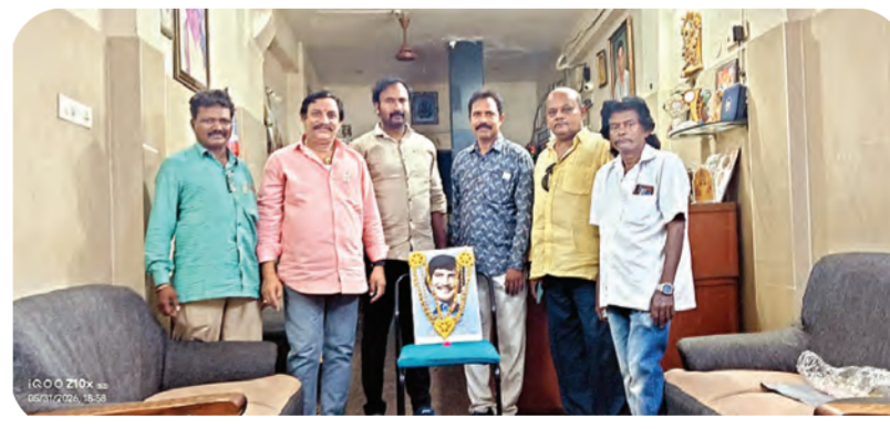
సత్తెనపల్లిలో ఘనంగా సూపర్ స్టార్ కృష్ణ జయంతి