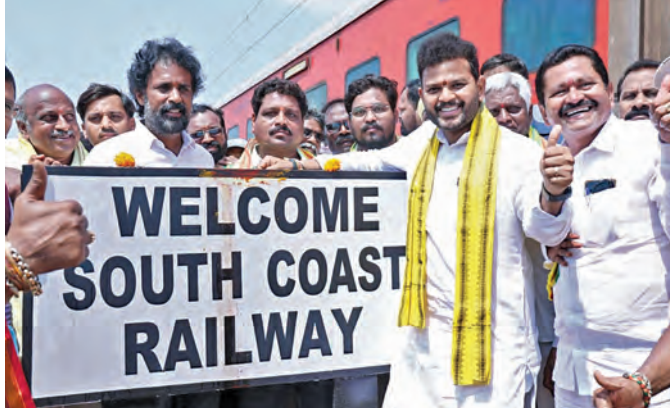
సోమవారం ఇచ్చాపురం రైల్వే స్టేషన్ వద్ద ప్రారంభ కార్యక్రమంలో

ఇచ్చాపురం (శ్రీకాకుళం జిల్లా), జూన్ 1 ప్రభాతవార్త: విశాఖపట్నం కేంద్రంగా దక్షిణ కోస్తా రైల్వే జోన్ ఏర్పాటుతో ఉత్తరాంధ్ర ప్రజల చిరకాల ఆకాంక్ష నెరవేరిందని కేంద్ర పౌర విమానయాన శాఖ మంత్రి కింజరాపు రామ్మోహన్ నాయుడు స్పష్టం చేశారు. సోమవారం ఇచ్చాపురం రైల్వే స్టేషన్ లో అత్యంత వైభవంగా నిర్వహించిన రైల్వే జోన్ ప్రారంభోత్సవం అధికారిక కార్యక్రమంలో కేంద్ర మంత్రి ముఖ్య అతిథిగా పాల్గొని ప్రసంగించారు. ఈ సందర్భంగా రామ్మోహన్ నాయుడు అత్యంత భావోద్వేగంతో మాట్లాడుతూ విశాఖ రైల్వే జోన్ సాధన కోసం గత 12 సంవత్సరాలుగా తాను సాగించిన సుదీర్ఘ పోరాటాన్ని గుర్తు చేసుకున్నారు. గతంలో పార్లమెంట్ లో ఈ అంశంపై అనేకసార్లు గళమెత్తానని, ఇదే ఇచ్చాపురం రైల్వే స్టేషన్ లో ప్రజాప్రతినిధిగా దీక్షలు కూడా చేపట్టానని పేర్కొన్నారు. అనాడు ఒక సామాన్య ప్రజాప్రతినిధిగా ప్రజల పక్షాన నిలబడి పోరాడాను. ఈలోకా కేంద్ర మంత్రిగా బాధ్యతలు నిర్వహిస్తున్న తరుణంలోనే ఆ కల నాకారం కావడం, నా చేతుల మీదుగానే ఈ జోన్ ప్రారంభం కావడం నా జీవితంలో ఎన్నటికీ మరువలేని మహత్తర ఘట్టం అని వార్తం వ్యక్తం చేశారు. సోమవారం నుండి విశాఖపట్నం కేంద్రంగా దక్షిణ కోస్తా రైల్వే జోన్ అధికారిక పరిపాలన ప్రారంభమైందని కేంద్ర మంత్రి వెల్లడించారు. నూతన జోన్ ఏర్పాటుతో ఈ ప్రాంత