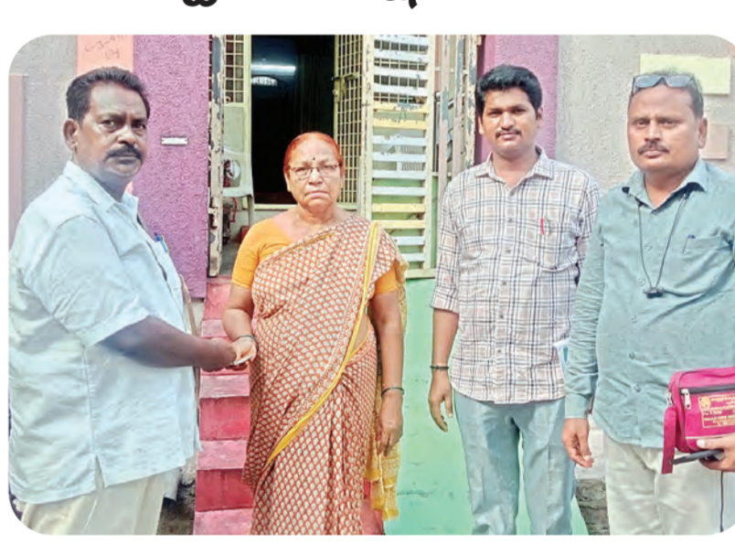
9 వార్డులో పెన్షన్లు అందజేత