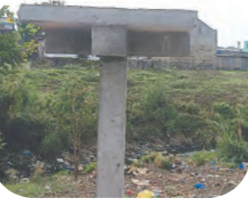
వాగులుపులపాడు, జూన్ 1, ప్రభాతవార్త

వాగులుపులపాడు, జూన్ 1, ప్రభాతవార్త మండల కేంద్రమైన నాగులుపులపాడు గ్రామంలోని పాత పంచాయతీ ఎదురుగా గల ఎన్టీఆర్ నగర్ విద్యుత్ వినియోగదారులు గత రెండు సంవత్సరాలుగా తీవ్రబాధలను ఎదుర్కొంటున్నారు.