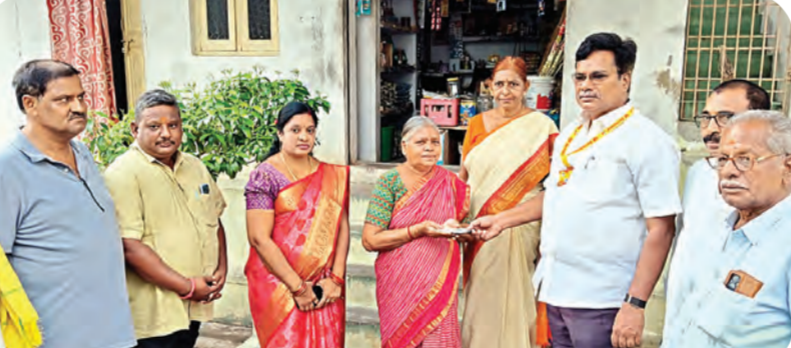
10వ వార్డులో పెన్షన్లు అందజేసిన ఖదరువూరి టిడిపి నేతలు