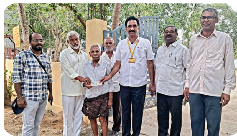
13వ వార్డులో ఎన్టీఆర్ భరోసా పింఛన్ల పంపిణీ