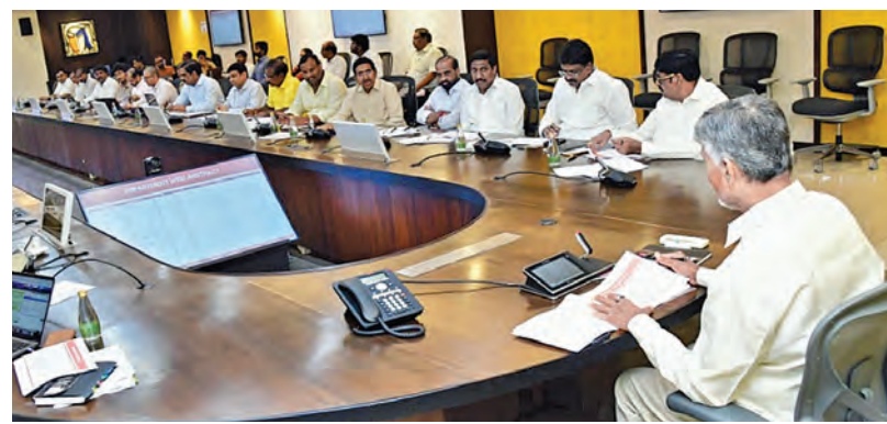
మంగళవారం సచివాలయంలో గోదావరి పుష్కరాలపై మంత్రులు, అధికారులతో సమీక్షిస్తున్న సిఎం చంద్రబాబు

ప్రతిష్టాత్మకంగా గోదావరి పుష్కరాలను నిర్వహించేందుకు అన్ని శాఖలూ సమన్వయంతో పనిచేయాలని సిఎం స్పష్టం చేశారు. గోదావరి పుష్కరాలు- 2027 నిర్వహణపై మంత్రుల కమిటీ, వివిధ శాఖల అధికారులతో సచివాలయంలో మంగళవారం ముఖ్యమంత్రి సమీక్ష నిర్వహించారు. అఖండ గోదావరి అభివృద్ధి ప్రాజెక్టుపై సమీక్షలో ముఖ్యమంత్రి సమగ్రంగా చర్చించారు. గోదావరి పుష్కరాల కన్నా ముందే పోలవరం ప్రాజెక్టును పూర్తి చేసి జాతీయ అంకితం చేస్తామని సమీక్షలో