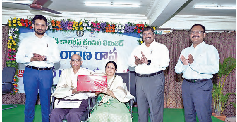
ఉత్తమ సేవలందించిన వారిని సన్మానిస్తున్న సింగరేణి యాజమాన్యం