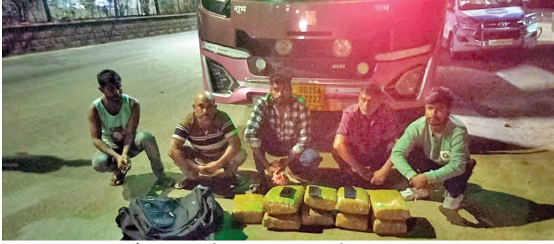
ఈగల్ టాస్క్ ఫోర్స్ పోలీసుల దాడిలో పట్టుబడ్డ గంజాయి తో స్ట్రగ్గర్లు, వారు ప్రయాణించిన బస్సు.