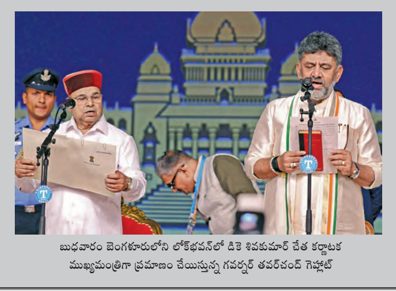
బుద్ధవారం బెంగళూరులోని లోక్ భవన్ లో డి.కె. శివకుమార్ చేత కర్ణాటక ముఖ్యమంత్రిగా ప్రమాణం చేయిస్తున్న గవర్నర్ తవర్చంద్ గెహ్లాట్

ఢిల్లీలో ఘోర అగ్ని ప్రమాదం భగ్గుమన్న రెస్టారెంట్ 21 మంది సజీవ దహనం మృతుల్లో 10 మంది విదేశీయులు రాష్ట్రపతి, ప్రధాని మోడీ సంతాపం న్యూఢిల్లీ, జూన్ 3: రాజధాని నగరంలోని మాల్వీయా నగర్ లో ఉన్న రెస్టారెంట్ బిల్డింగ్ లో జరిగిన అగ్ని ప్రమాదంలో 21 మంది మృతిచెందారు. మరో 40 మందికి గాయాలు తీవ్రంగా పాలయినట్లు ఆధికారులు తెలిపారు. అయితే