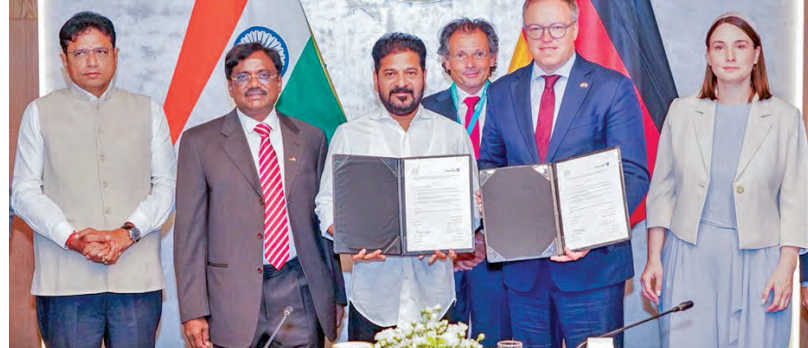
బుధవారం సీఎం రేవంత్ రెడ్డి, తురింగియా ముఖ్యమంత్రి మారీయో ఒప్పందం ప్రకటించారు. మధ్యకుంటున్న దృశ్యం. చిత్రంలో మంత్రిలు శ్రీధర్ బాబు, వివేక్

తెలంగాణ రైజింగా ద్వారానికతపై జర్నలి ప్రతినిధుల ప్రశంసలు అవసరమైన నైపుణ్యాలతో తెలంగాణ యువతను తీర్చిదిద్దుతున్నాం: సీఎం రేవంత్ రెడ్డి