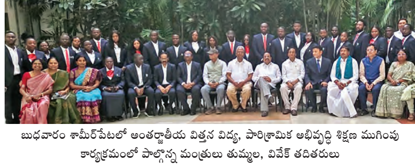
బుధవారం శామీరపేటలో అంతర్జాతీయ విత్తన విద్య, పాలిటెక్నిక్ అభివృద్ధి శిక్షణ ముగింపు కార్యక్రమంలో పాల్గొన్న మంత్రులు తుమ్మల, వివేక్ తదితరులు

వ్యవసాయం, విత్తన రంగాల్లో తెలంగాణ - టరాబా రాష్ట్రాల మధ్య భాగస్వామ్యం మరియు బలహీనత అంతర్జాతీయ విత్తన విద్య, పాలిటెక్నిక్ అభివృద్ధి శిక్షణ ముగింపు మంత్రులు తుమ్మల, వివేక్