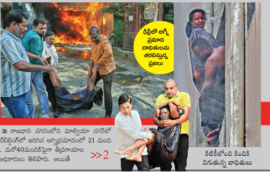
ఢిల్లీలో అగ్ని ప్రమాద బాధితులను తరలిస్తున్న ప్రజలు కిడికి లోచి కిందికి దిగుతున్న బాధితులు

ఢిల్లీలో ఘోర అగ్ని ప్రమాదం భగ్గుమన్న రెస్టారెంట్ 21 మంది సజీవ దహనం మృతుల్లో 10 మంది విదేశీయులు రాష్ట్రపతి, ప్రధాని మోడీ సంతాపం న్యూఢిల్లీ, జూన్ 3: రాజధాని నగరంలోని మాల్వీయా నగర్ లో ఉన్న రెస్టారెంట్ బిల్డింగ్ లో జరిగిన అగ్ని ప్రమాదంలో 21 మంది మృతిచెందారు. మరో 40 మందికి గాయాలు తీవ్రంగా పాలయినట్లు ఆధికారులు తెలిపారు. అయితే