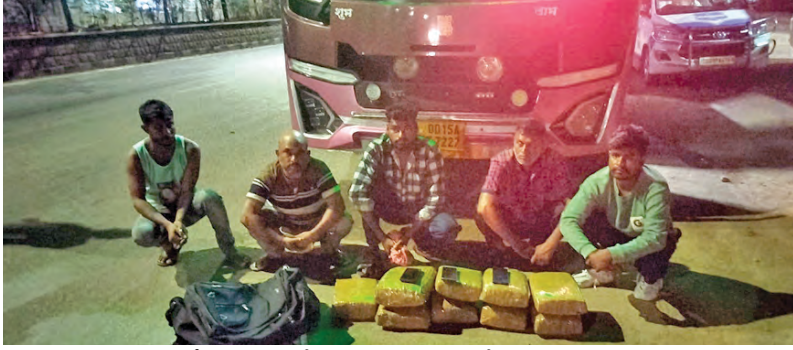
ఈగల్ టాస్క్ ఫోర్స్ పోలీసుల దాడిలో పట్టుబడ్డ గంజాయి తో స్ట్రగ్గి, వారు ప్రయాణించిన బస్సు.