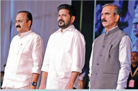
బుధవారం బెంగళూరులో కర్ణాటక సీఎం గా డి.కె. శివకుమార్ ప్రమాణాభిషేకం చేసిన సీఎం రేవంత్, కేరళ సీఎం సతీశ్ తదితరులు