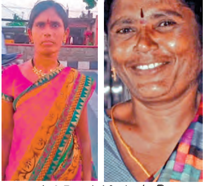
మృతి చెందిన మహిళలు