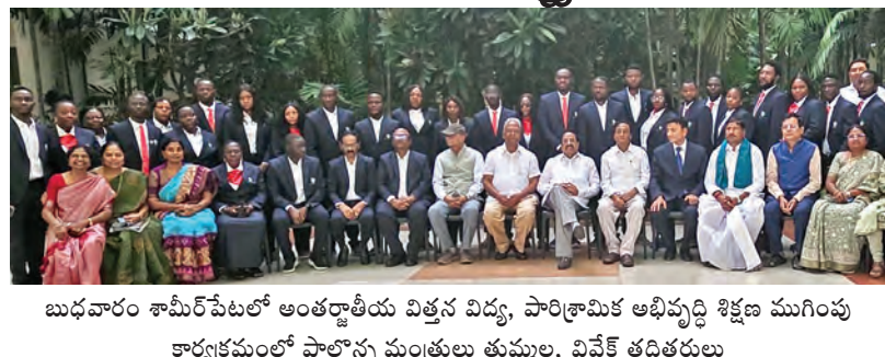
బుధవారం శామీరపేటలో అంతర్జాతీయ విత్తన విద్య, పాలిట్రామిక అభివృద్ధి శిక్షణ ముగింపు కార్యక్రమంలో పాల్గొన్న మంత్రులు తుమ్మల, వివేక్ తదితరులు

వ్యవసాయం, విత్తన రంగాల్లో తెలంగాణ - టరాబా రాష్ట్రాల మధ్య భాగస్వామ్యం మరింత బలోపేతం అంతర్జాతీయ విత్తన విద్య, పాలిట్రామిక అభివృద్ధి శిక్షణ ముగింపు కార్యక్రమంలో పాల్గొన్న మంత్రులు తుమ్మల, వివేక్