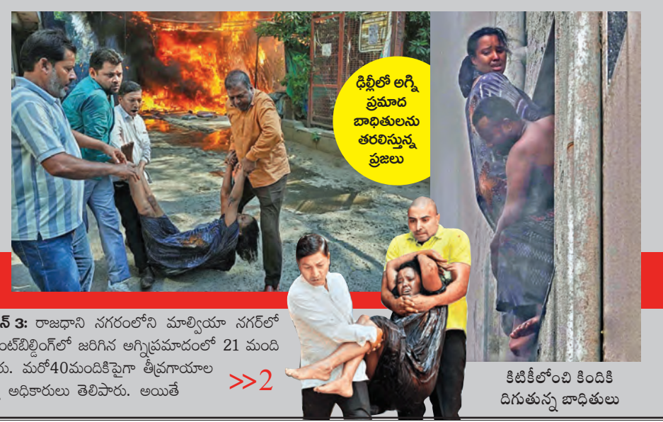
న్యూఢిల్లీ, జూన్ 3: రాజధాని నగరంలోని మాల్వీయా నగర్లో ఉన్న రెస్టారెంట్ బిల్డింగ్లో జరిగిన అగ్నిప్రమాదంలో 21 మంది మృతిచెందారు. మరో 40 మందికి గాయాలు తీవ్రంగా పాలయినట్లు ఆధికారులు తెలిపారు. అయితే ఢిల్లీలో అగ్ని ప్రమాద బాధితులను తరలిస్తున్న ప్రజలు కిడినీలోంచి కిందికి దిగుతున్న బాధితులు

ఢిల్లీలో ఘోర అగ్ని ప్రమాదం భగ్గుమన్న రెస్టారెంట్ 21 మంది సజీవ దహనం మృతుల్లో 10 మంది విదేశీయులు రాష్ట్రపతి, ప్రధాని మోడీ సంతాపం