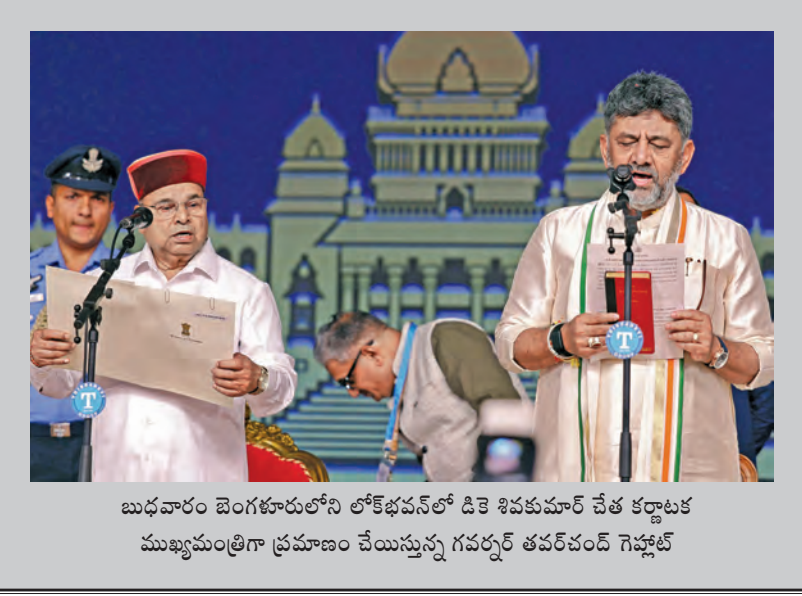
బుధవారం బెంగళూరులోని లోక్భవన్లో డి.కె. శివకుమార్ చేత కర్ణాటక ముఖ్యమంత్రిగా ప్రమాణం చేయిస్తున్న గవర్నర్ తవర్చంద్ గెహ్లాట్

ఢిల్లీలో ఘోర అగ్ని ప్రమాదం భగ్గుమన్న రెస్టారెంట్ 21 మంది సజీవ దహనం మృతుల్లో 10 మంది విదేశీయులు రాష్ట్రపతి, ప్రధాని మోడీ సంతాపం