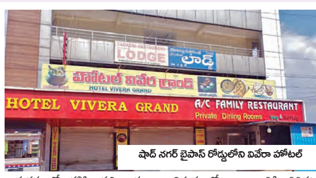
పాన్ వనగర్ బైపాస్ రోడ్డులోని వివేరా హోటల్