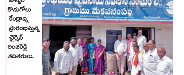
జొన్నల కొనుగోలు కేంద్రాన్ని ప్రారంభిస్తున్న చైర్మన్ అంజిరెడ్డి తదితరులు.

మోషిరపేట్, జూన్ 3, ప్రభాతవార్త : మండల పరిధిలోని మేకవనంపల్లి ప్రాథమిక పాఠశాల సమ